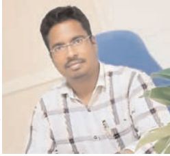
ప్రజాభూమి ప్రతినధి - విజయవాడ