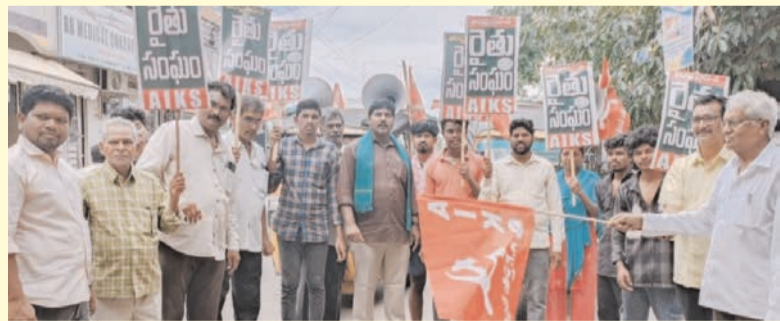
ప్రజాభూమి ప్రతినిధి-ఏలూరు జిల్లా

-జూలై 3న రైతుల బహిరంగ సభను జయిస్తూ చేయండి.