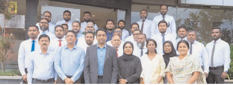
ప్రజాభూమి ప్రతినధి - విజయవాడ