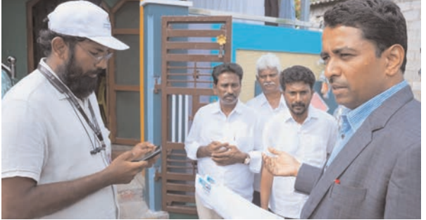
ప్రజాభూమి ప్రతినధి - విజయవాడ