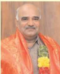
ప్రజాభూమి ప్రతినిధి-ఏలూరు జిల్లా