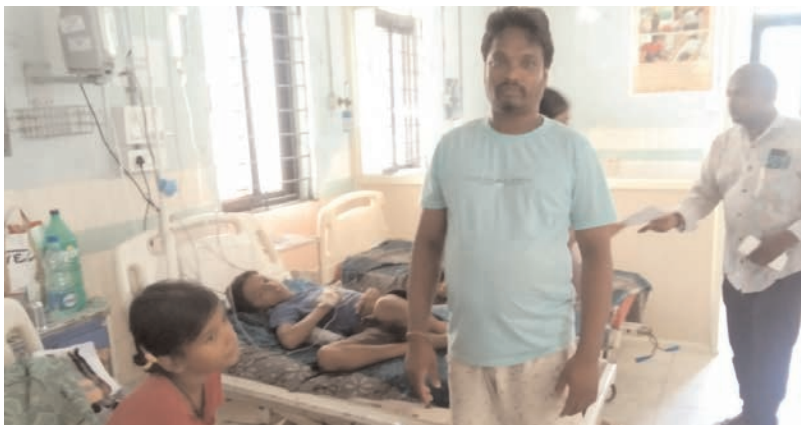
ప్రజాభూమి ప్రతినధి - ఆగిరిపల్లి

మించి తనకు ఏం తెలియదని తీసు తెలియజేశారు. అయితే శుక్రవారం బట్టలు తిన్న తిన్నవారు మాత్రం కొద్ది గంటల వ్యవధిలోనే వాంతులు, విరేచనాలు, జ్వరం కడుపు నొప్పితో బాధపడుతూ రాత్రి సమయం కావడంతో నిర్లక్ష్యం చేయడంతో శనివారం ఉదయానికి మరింతగా ప్రభావం చూపుడంతో స్థానిక ఆసుపత్రిలో చేరడంతో వైద్య సేవలు అందించి సప్పటికి పూర్తి స్థాయిలో కోలుకోలేని పరిస్థితి నెలకొంది. దీంతో గ్రామంలో పలువురు గ్రామ విడిచి వెళ్లి వివిధ చోట్ల ప్రైవేటు ఆస్పత్రుల్లో చేరి వైద్యసేవలు పొందారు. కానీ రామచంద్రపురం ఏరియా