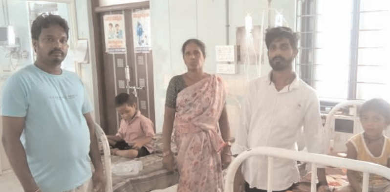
ప్రజాభూమి ప్రతినధి - ఆగిరిపల్లి