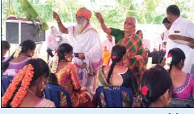
నిర్వహించడం స్వామివారి కృపతోనే ఇంత వైభవంగా నిర్వహించామని, ముఖ్యంగా లోకాలనేతీ దేవుడైనా ప్రతి మానవజీవుడికి తల్లి గర్భాలయం మహాదేవాలయమని తెలియజేశారు. ప్రతి ఒక్కరూ ఆరోగ్యంగా పిల్లలకు జన్మనిచ్చి స్వామి వారి ఆలయ ఆరవ వార్షికోత్సవములో నామకరణం మహోత్సవం జరగాలని ఆ భగవంతున్ని ప్రార్థించారు. ఇంతటి మునూర్ర కార్యక్రమానికి సహాయ సహకారాలు అందించిన ప్రతి ఒక్కరికీ, కుటుంబ

ప్రజా భూమి ప్రతినిధి, రామచంద్రపురం రామచంద్రాపురం మండలం రాయలచెరువు పంచాయితీ చాయాపురంలో వెలిసి ఉన్న శ్రీ శనిశ్వర స్వామి వారి ఆలయ ఐదవ వార్షికోత్సవాల మూడవ రోజులు పాటు ఘనంగా జరుగుతున్నాయి. ఇందులో భాగంగా గురువారం రెండవ రోజు స్వామి వారి ఆలయ ఆవరణలో ఎంతో ప్రతిష్టాభరితంగా నిర్వహించుకున్న శ్రీ మహా మండలేశ్వర స్వామి ప్రాంగణంలో స్వామి సేవా ఉత్సవంలో దాదాపు 65 మంది గర్భిణీ శ్రీ మాతృమూర్తులకు సామూహిక సీమంతం కార్యక్రమం ఆగమశాస్త్రోత్తంగా వైభవంగా నిర్వహించారు. ప్రతి ఒక్క గర్భిణీ