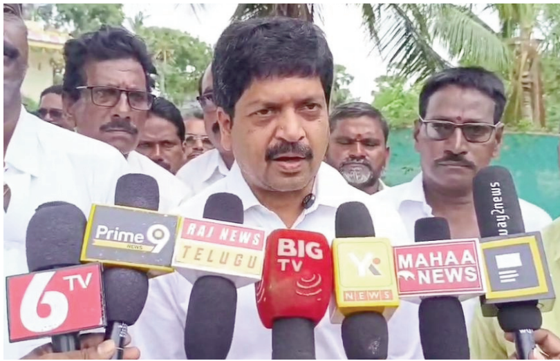
యాూూర్స్ రాజకీయం: 2019 ఎన్నికల ముందు అమరావతి రాజధాని అన్న జగన్, అధికారంలోకి రాగానే మూడు రాజధానుల పేరుతో రాష్ట్రాన్ని ఐదేళ్లు వెనక్కి నెట్టారు.పెట్టుబడులను

యాలని పిలుపు మచిలీపట్నం/ప్రజాభూమి ప్రతినిధి వైసీపీ అధినేత వైఎస్ జగన్ మాహన్ రెడ్డి వైఖరిపై రాష్ట్ర మైనింగ్, ఎక్స్లైట్ శాఖ మంత్రి కొల్లు రవీంద్ర తీవ్రస్థాయిలో భ్వజనమొత్తారు. జగన్ నిలకడ లేని మనస్తత్వమని, రాష్ట్రాన్ని సర్వనాశనం చేయడమే ధ్యేయంగా ఆయన వ్యవహరిస్తున్నారని విమర్శించారు. మచిలీపట్నంలో గురువారం జరిగిన భారత్ వికాస్ డీ రాం టీ ప్రారంభోత్సవ కార్యక్రమంలో పాల్గొన్న మంత్రి, అనంతరం మీడియాతో మాట్లాడారు. ఈ సందర్భంగా జగన్ అడ్డగీలు విధానంపై ఆయన సెప్పలు చెరిగారు. నాడు తుగ్గేశా.. నేడు సైకో: "నాడు జగన్ తుగ్గేశా, సైకో అని ఊరికే అనలేదు. అధికారం పొందాక అయినా మార్పు వస్తుందనుకుంటే.. ఈ రెండో క్షణో ఆయనలో సైకో ప్రవర్తన మరింత వెలిగింది."