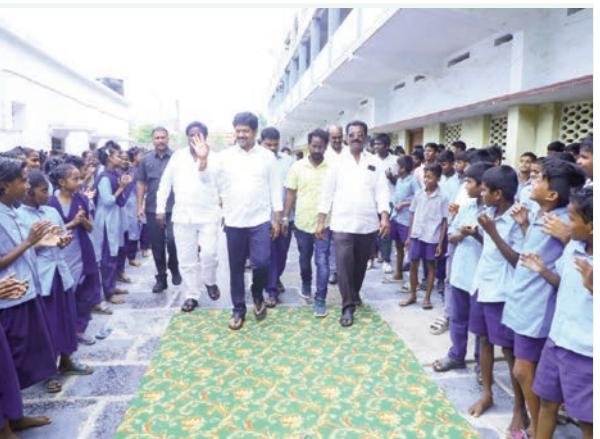
మచిలీపట్నంలో హైనీ ఫౌండేషన్ ఆధ్వర్యంలో ఘనంగా పాఠశాల సామాగ్రి పంపిణీ విద్యారంగంలో సమూల మార్పులకు శ్రీకారం.. విద్యార్థులకు మెరుగైన వసతుల కల్పనే ధ్యేయం

కేవలం పాఠశాల చెప్పడమే కాదు.. విద్యార్థులకు ఆవసరమైన ఆధునిక వసతులు, ఆహారకరమైన వాతావరణం కల్పించినప్పుడే వారిలో నృణాత్మకత పెరుగుతుంది. కృతజ్ఞతలు: సమాజ సేవలో భాగస్వాములవుతూ, పేద విద్యార్థులకు అండగా నిలుస్తున్న "హైనీ ఫౌండేషన్" నిర్వాహకులను మంత్రి ఈ సందర్భంగా అభినందించారు. ఇటువంటి స్వచ్ఛంద సంస్థల సహకారం అభినందనీయమన్నారు. "పేదరికం చదువుకు అడ్డంకి కాకూడదు. ప్రతి విద్యార్థి ఉన్నత తీరులను అధిరోహించాలనేదే కూటమి ప్రభుత్వ సంకల్పం." ఈ కార్యక్రమంలో హైనీ ఫౌండేషన్ ప్రతినిధులు, స్థానిక కూటమి నాయకులు, ఉపాధ్యాయులు, విద్యార్థులు మరియు వారి తల్లిదండ్రులు పెద్ద సంఖ్యలో పాల్గొన్నారు. ఉచితంగా బ్యాగులు, పుస్తకాలు అందుకున్న విద్యార్థులు మరియు తల్లిదండ్రులు మంత్రికి, ఫౌండేషన్ నిర్వాహకులకు కృతజ్ఞతలు తెలిపారు.