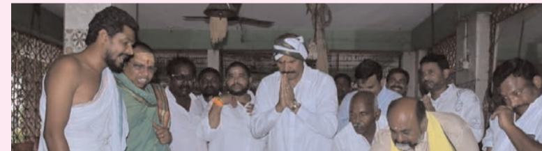
ప్రజా భూమి ప్రతినిధి-ఆగిరిపల్లి

ఆగిరిపల్లి మండలం ఈడర్ గ్రామంలోని శ్రీ పంగడమ్మ తల్లి ఆలయంలో రాష్ట్ర గృహనిర్మాణ, సమాచార-సౌర సంబంధాల శాఖ మంత్రి కొలుసు పార్థసారథి ప్రత్యేక పూజలు నిర్వహించారు. ఈ సందర్భంగా ఆయన మాట్లాడుతూ ఆలయాలు భారతీయ సంస్కృతి, సంప్రదాయాలకు పునాదులు, దేవాలయాల అభివృద్ధి, ఆధ్యాత్మిక వైతన్యంతో సమాజంలో ఐక్యత, గ్రామాల సమగ్ర అభివృద్ధి సాధ్యమవుతుందన్నారు. రాష్ట్ర ప్రజలందరూ ఆయుర్వేదం, సుఖంతో పాఠాల్లో ఉండాలని, సకాలంలో వర్షాలకు కుసీ రైతులు పాడిమంటలతో సుభిక్షంగా జీవించాలని అభ్యుపాసించి ప్రార్థించినట్లు తెలిపారు. అనంతరం ఆలయ కమిటీ సభ్యులు మంత్రిని సత్కరించగా, ప్రజాప్రతినిధులు, కూటమి నాయకులు, భక్తులు, గ్రామస్తులు పాల్గొన్నారు.