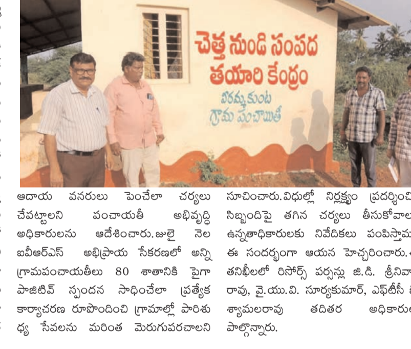
ఆదాయ వనరులు పెంచేలా చర్యలు చేపట్టాలని పంచాయతీ అభివృద్ధి అధికారులను ఆదేశించారు. జూలై నెల ఐటీఆర్ఎస్ అభిప్రాయ సేకరణలో అన్ని గ్రామపంచాయతీలు 80 శాతానికి పైగా పాజిటివ్ స్పందన సాధించేలా ప్రత్యేక కార్యచరణ రూపొందించి గ్రామాల్లో పారిశుధ్య సేవలను మరింత మెరుగుపరచాలని

సేకరించకపోవడం, అలాగే తడి చెత్తతో వర్మి కంపోస్ట్ తయారీ చేపట్టకపోవడం వంటి లోపాలను గుర్తించి సంబంధిత పంచాయతీ అభివృద్ధి అధికారులను నిలదీశారు. పాస్టిక్ వేస్ట్ మేనేజ్మెంట్ పలు శిక్షణ కార్యక్రమాల ద్వారా అధికారులకు అవగాహన కల్పించినప్పటికీ, వాటి అమలులో ఆసించిన ఫలితాలు కనిపించడం లేదని ఆయన ఆవేదన వ్యక్తం చేశారు. జిల్లాలోని అన్ని గ్రామపంచాయతీలలో విన ప్రమాణాలకు అనుగుణంగా పూర్తి స్థాయిలో పనిచేయాలని, తడి-పొడి చెత్తతో తప్పనిసరిగా వేర్వేరుగా సేకరించి తడి చెత్తతో నాణ్యమైన వర్మి కంపోస్ట్ తయారీ చేయాలని సూచించారు. అదేవిధంగా స్వచ్ఛ రథం ద్వారా ప్రజల్లో పారిశుధ్యంపై విస్తృత అవగాహన కల్పించాలని, పొడి చెత్తను శాస్త్రీయంగా వినియోగించి గ్రామపంచాయతీలకు సొంత