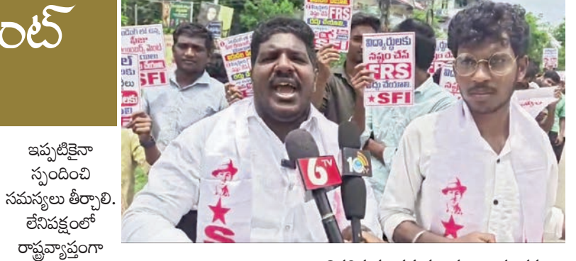
మెన్ & కాన్సోటిడ్ ఛార్జీలు: హాస్టల్ విద్యార్థుల మెన్ ఛార్జీలను ₹3000లకు పెంచడంతో పాటు, నిలిచిపోయిన కాన్సోటిడ్ ఛార్జీలను విడుదల చేయాలి. జి.ఎం. 77 వంటి విద్యార్థులకు స్వయం చేకూరుస్తున్న జి.ఎం. నెంబర్ 77ను తక్షణమే రద్దు చేసి, వారికి కూడా ఫీజు రీయంబర్స్ మెంట్ వర్తింపజేయాలి. డిగ్రీ అడ్మిషన్లు: అలసత్వం చేయకుండా డిగ్రీ అడ్మిషన్ ప్రక్రియను వెంటనే ప్రారంభించాలి. DRO కి