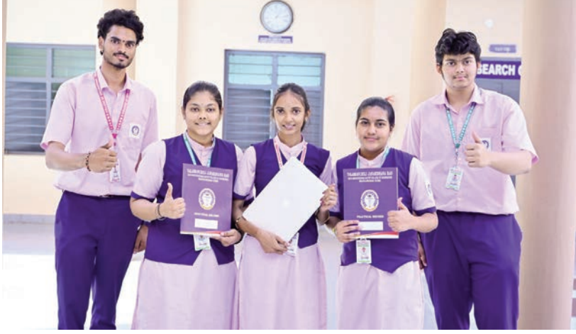
వైజ్ఞానిక డీఎంఎస్ ఇంజనీరింగ్ కళాశాల విధానం

లక్షల మంది ఇంజనీరింగ్ గ్రాడ్యుయేట్లు తయారవుతున్నారని వారల్లో సగం కంటే తక్కువ మంది మాత్రమే పరిశ్రమలలో పనిచేయడానికి వెంటనే సిద్ధంగా ఉన్నారని అధ్యయనాలు చెబుతున్నాయి. పరిశ్రమలు నేడు సాంకేతిక పరిజ్ఞానం కలిగిన వారికంటే, క్రమశిక్షణతో కూడిన బాధ్యతాయుతమైన యువతను ఎక్కువగా కొరకుంటున్నాయి. సుమారు 73 శాతం మంది సంస్థ యజమానులు అకాడమిక్ గ్రేడ్ కంటే ప్రాక్టికల్ అనుభవం మరియు సమస్య పరిష్కార నైపుణ్యాలు కలిగిన అభ్యర్థులకు ప్రాధాన్యత ఇస్తున్నారు. ఆధునిక ఇంజనీరింగ్ కేవలం సాంకేతిక పనులకు పరిమితం కాదు; ఇది సమాచార, డిజిటల్, డేటా-ఆధారిత మరియు విభాగాల మధ్య లోతుగా అనుసంధానించబడి ఉంది. క్రమ శిక్షణ విద్యార్థులలో ఏకాగ్రతను పెంపొందించడమే