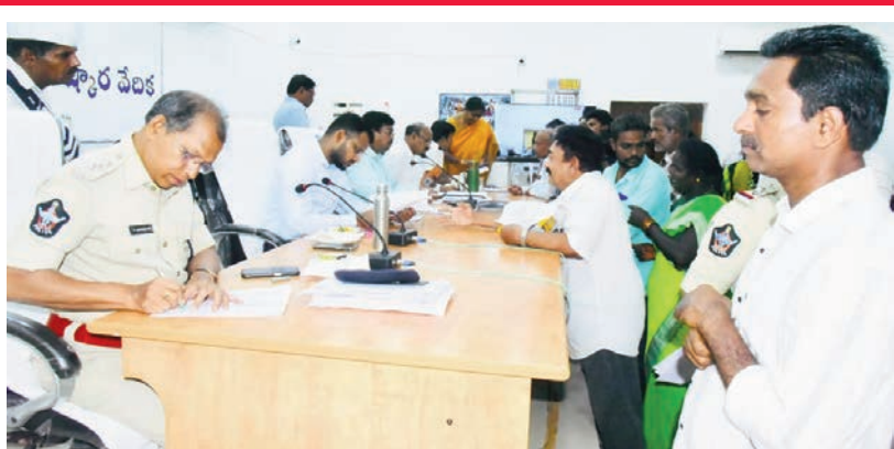
మండలం ఉల్లిపాలెం గ్రామం 11, 12వ వార్డులలో నివసిస్తున్న సుమారు 150 మార్కులకు కుటుంబాలు రాజీవేక చేపల వేటకు వేళ్ల సమయంలో తీవ్ర ఇబ్బందులు ఎదుర్కొంటున్నామని, కోప్పనాటి జగన్మోహన్ ఇంటి నుంచి లింగం నరసింహస్వామి వంటి వరకు సుమారు 500 మీటర్ల మేర విద్యుత్ స్తంభాలు, వీధి దీపాలు లేకపోవడంతో పీజీఆర్ఎస్ ప్రమాదాలకు గురవుతున్నామని సడకడిబి ఆజనయలు జిల్లా కలెక్టర్ కు ఫిర్యాదు చేశారు. ఈ నేపథ్యంలో సదరు రోడ్లపై విద్యుత్ స్తంభాలు, వీధి దీపాలను తక్షణమే ఏర్పాటు చేయాలని విజ్ఞప్తి చేశారు. జిల్లా కలెక్టర్ కు ఫిర్యాదులను వెంటనే పరిష్కరించే చర్యలు తీసుకోవాలని సూచించారు. సోమవారం ఉదయం కలెక్టరేట్లోని పీజీఆర్ఎస్ సమావేశపు మందిరంలో జాయింట్ కలెక్టర్ ప్రజా సమస్యల పరిష్కార వేదిక - మీకోసం కార్యక్రమం నిర్వ

హారలో సంబంధిత అధికారులు పీజీఆర్ఎస్ పోర్టల్ లో "యెట్-టు-వ్యూ"లో ఉన్న దరఖాస్తులను తప్పనిసరిగా పరిశీలించి సంబంధిత అధికారులకు తీసుకువచ్చాలని ఇప్పటికే పలుమార్లు సూచించినప్పటికీ, అదేకాదు అనుమతి నిర్వహించకపోవడం కనిపిస్తున్నట్లు ప్రజలకు తెలియజేశారు. పంచాయతీరాజ్, మున్సిపల్ అడ్మినిస్ట్రేషన్, ఆర్డర్లు, ఫిర్యాదులను వెంటనే పరిష్కరించే చర్యలు తీసుకోవాలని సూచించారు. సోమవారం ఉదయం కలెక్టరేట్లోని పీజీఆర్ఎస్ సమావేశపు మందిరంలో జాయింట్ కలెక్టర్ ప్రజా సమస్యల పరిష్కార వేదిక - మీకోసం కార్యక్రమం నిర్వ