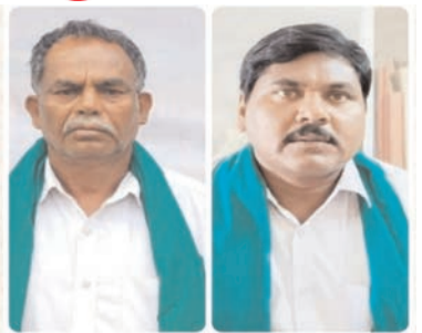
నూతన ఆయిల్ ఫెడ్ కర్మిగారం నిర్వహించాలని, ఓ.ఈ.ఆర్ పేరుతో ప్రైవేట్ ఆయిల్ పామ్ ఫ్యాక్టరీలు రైతులను దోపిడీ చేసే విధానం ఆపాలని డిమాండ్ చేశారు. కోకో పంటకు