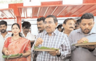
సంఘాల మహిళలను ఆర్థికంగా బలోపేతం చేయడమే ప్రభుత్వ లక్ష్యమని చెప్పారు. రూ. 11 లక్షల రుణంతో నలుగురు డ్యూక్రా మహిళల ద్వారా ఏర్పాటు చేసిన తృప్తి క్యాంటీన్ విజయవంతంగా కొనసాగుతోందని, త్వరలో మరో క్యాంటీన్లను కూడా ఏర్పాటు చేసేందుకు చర్యలు తీసుకుంటున్నామని తెలిపారు. కార్యక్రమంలో జిల్లా కలెక్టర్, జాయింట్ కలెక్టర్, ఇతర అధికారులు, ప్రజా ప్రతినిధులు, పార్టీ నాయకులు పాల్గొన్నారు.