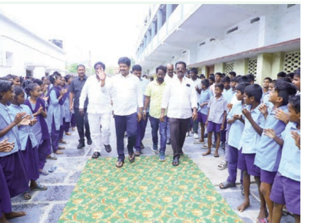
మచిలీపట్నంలో హైనీ ఫౌండేషన్ ఆధ్వర్యంలో ఘనంగా పాఠశాల సామాగ్రి పంపిణీ విద్యారంగంలో సమూల మార్పులకు శ్రీకారం.. విద్యార్థులకు మెరుగైన వసతుల కల్పనే ధ్యేయం

కేవలం పాఠాలు చెప్పడమే కాదు.. విద్యార్థులకు ఆవసరమైన ఆధునిక వసతులు, ఆహారకరమైన వాతావరణం కల్పించినప్పుడే వారిలో సృజనాత్మకత పెరుగుతుంది. కృతజ్ఞతలు: సమాజ సేవలో భాగస్వాములవుతూ, పేద విద్యార్థులకు అండగా నిలుస్తున్న "హైనీ ఫౌండేషన్" నిర్వాహకులను మంత్రి ఈ సందర్భంగా అభినందించారు. ఇటువంటి స్వచ్ఛంద సంస్థల సహకారం అభినందనీయమన్నారు. "పేదరికం చదువుకు అడ్డంకి కాకూడదు. ప్రతి విద్యార్థి ఉన్నత తీరులను అధిరోహించాలనేదే కూటమి ప్రభుత్వ సంకల్పం." ఈ కార్యక్రమంలో హైనీ ఫౌండేషన్ ప్రతినిధులు, స్థానిక కూటమి నాయకులు, ఉపాధ్యాయులు, విద్యార్థులు మరియు వారి తల్లిదండ్రులు పెద్ద సంఖ్యలో పాల్గొన్నారు. ఉచితంగా బ్యాగులు, పుస్తకాలు అందుకున్న విద్యార్థులు మరియు తల్లిదండ్రులు మంత్రికి, ఫౌండేషన్ నిర్వాహకులకు కృతజ్ఞతలు తెలిపారు.