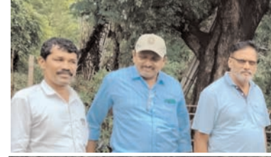
పూర్తిగా ధ్వంసం అయ్యే పరిస్థితి కనిపిస్తుంది.