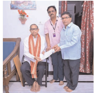
కార్యక్రమాన్ని ఒక ప్రధానమైన కర్తవ్యంగా భావించి ప్రతి ఒక్కరూ బాధ్యతగా ముందుకు రావాలని చాగంటి కోటేశ్వరరావు కోరారు. అధికారులు అందజేసిన ఎన్రోల్మెంట్ పత్రాలను సత్వరం పూర్తి చేసి తిరిగి ఇవ్వాలని,

ప్రారంభమైన ఈ ఓటర్ల జాబితాల సమగ్ర పునశ్చరణ మరియు నూతన సమాధి ప్రక్రియ ఈ నెల 14వ తారీకు వరకు కొనసాగుతుందని పౌరులందరూ తమ కుటుంబ సభ్యులకు సంబంధించిన వివరాలన్నింటినీ ఎలాంటి దాపరికం లేకుండా స్పష్టంగా అందజేయాలని కోరారు. దీనివల్ల అర్హులైన ఓటర్లను గుర్తించి, పాఠదర్శకమైన ఓటర్ల జాబితాను సిద్ధం చేయడం అధికారులకు తేలికపాటుగా ఉంటుంది అని పేర్కొన్నారు. ఓటర్ల జాబితా పక్కాగా ఉన్నప్పుడే, రేవణి రోజున ఒక మంది ప్రభుత్వాన్ని, నలైన ప్రజాప్రతినిధులను ఎంచుకునే అవకాశం ప్రజలకు లభిస్తుందని ఆయన అభిప్రాయపడ్డారు. ఈ బృహత్తర