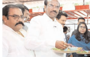
యాతో మాట్లాడుతూ రాష్ట్రవ్యాప్తంగా ఇప్పటికే స్వయం సహాయక సంఘాల మహిళలకు ఉపాధి కల్పించామని, త్వరలో మరిన్ని ప్రాంతాలకు ఈ కార్యక్రమాన్ని విస్తరిస్తామని తెలిపారు. ఏలూరులో నిర్వహణ ఆదర్శవంతంగా ఉందని ప్రశంసించి, నగరంలో మరో తృప్తి క్యాంటీన్లను కూడా ఏర్పాటు చేయమని స్పష్టం చేశారు. ఏలూరు ఎమ్మెల్యే బడేటి చంటి మాట్లాడుతూ స్వయం సహాయక

ప్రజాభూమి ప్రతినిధి-ఏలూరు మహిళలకు ఉపాధి అవకాశాలు కల్పించి, వారిని ఆర్థికంగా స్వావలంబన దిశగా నడిపించేందుకు కూటమి ప్రభుత్వం తృప్తి క్యాంటీన్ల ఏర్పాటు కార్యక్రమాన్ని విస్తరిస్తోందని రాష్ట్ర మున్సిపల్ పరిపాలన, పట్టణాభివృద్ధి శాఖ మంత్రి డాక్టర్ పొంగూరు నారాయణ తెలిపారు. శనివారం ఏలూరులో మెప్పా ఆధ్వర్యంలో స్వయం సహాయక సంఘాల మహిళలు నిర్వహిస్తున్న తృప్తి క్యాంటీన్లను ఆయన సందర్శించి నిర్వహణ తీరును పరిశీలించారు. క్యాంటీన్ నిర్వహణకు మాట్లాడి ఆదాయ, వ్యయాల వివరాలు అడిగి తెలుసుకున్నారు. అనంతరం ఎమ్మెల్యే బడేటి చంటి, అధికారులు, ప్రజాప్రతినిధులతో కలిసి అల్లూరిలో చేసిన పంజాబ్ నాణ్యతపై సంతృప్తి వ్యక్తం చేశారు. అనంతరం మంత్రి మీడి