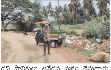
దని స్థానికులు ఆవేదన వ్యక్తం చేస్తున్నారు. దోమలు, ఈగలు పెరిగిపోయి పరిసర ప్రాంతాలు అపరిశుభ్రంగా మారుతున్నాయని, అంటువ్యాధులు ప్రబల ప్రమాదం ఉందని ఆందోళన చెందుతున్నారు. "గ్రామాన్ని శుభ్రం చేయాల్సిన పంచాయతీ వారే.. ఇలా ప్రధాన ఇరుకాచి మార్జిన్లపై చెత్త వేయడం ఏంటో అర్థం కావడం లేదు. రాత్రి వేళల్లో ఇక్కడే పేరుకుపోవడంతో భయంగా ఉంటోంది"

ప్రజాభూమి ప్రతినిధి-చింతలపూడి ఏలూరు జిల్లా చింతలపూడి మండలం ప్రగడవరం పంచాయతీ పరిధిలో నిత్యం ప్రయాణించే వాహనదారులు, స్థానిక ప్రజలు తీవ్ర ఇబ్బందులు ఎదుర్కొంటున్నారు. పంచాయతీ నిబ్బంది గ్రామంలో సేకరిస్తున్న తడి, పొడి చెత్తను రోడ్డు మార్జిన్లపైనే గుట్టలుగా వేస్తుండటమే ఇందుకు ప్రధాన కారణం. రోడ్డు పక్కనే చెత్తను వేస్తుండటంతో రవాణాపై వెళ్లే ద్విచక్ర వాహనదారులు, ఇతర వాహన చోదకులు తీవ్ర ఇబ్బందులకు గురవుతున్నారు. ఒకవైపు ఈ చెత్త పల్లె మార్గం ఇరుకాచి మారి ప్రమాదాలు జరిగే అవకాశం ఉండగా, మరోవైపు రోజూ తరబడి చెత్త అక్కడే పేరుకుపోవడంతో తీవ్ర దుర్వాసన వస్తో