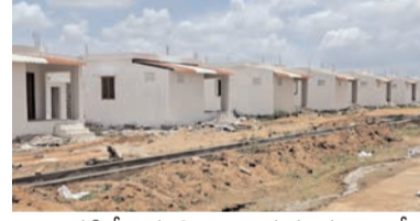
రిగా పడితే పరిస్థితి తారుమారు అయ్యే అవకాశాలు లేకపోతే అన్న సందేహాలను వ్యక్తం చేయటం కొనసాగుతున్న ఏపీ ఏమైనా పునరావాస గృహాలపై అప్పగిస్తే ఆర్డీ గృహాలలో సామాగ్రిని భద్రపరచాల్సిన దుస్థితి ఉందని కూడా అంటున్నారు. వాస్తవానికంటే వేగంగానే జరుగుతున్నప్పటికీ ఏ ఒక్క గ్రామానికి జూలై నెల వచ్చిన చూపక పోవడంతో నిర్వాసితుల ప్రజల్లో ఎదురుచూపులు మొదలయ్యాయి. ఇప్పటికైనా సంబంధిత అధికారులు పునరావాస గృహాల నిర్మాణాలపై తగు సమాచారాలను సంబంధిత గ్రామాలకు చేరవేయాల్సిన అవసరం ఎంతైనా ఉంది.