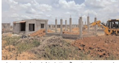
యాలను త్వరితగతిన తెలపాలని పలు గ్రామాల ప్రజలు కోరుతున్నారు. గోదావరి వరద వచ్చే సమయం ఆసన్నం కావడంతో ప్రజల్లో పునరావాస గృహాలపై ఆలోచన ముఖ్యం. ఇప్పటివరకు వర్షాలు లేక గోదావరిలో కొత్తనీరు చేరకపోవడంతో ఈ విధాని వరదలు రానట్లే కథలాల్సిన అవసరం లేదు అన్నా ధీమాలో ఉన్నారు. అలస్యంగా వర్షాలు ఒక్కసా

ప్రజాభూమి ప్రతినిధి-వేలేరుపాడు పోలవరం ప్రాజెక్టు కారణంగా నిర్వాసితులుగా మారిన ప్రజలకు ప్రభుత్వం పునరావాస ప్రాంతాలలో నిర్మిస్తున్న కాలనీ గృహాలకు సంబంధించిన సమాచారం అందటం లేదని నిర్వాసితులు ప్రశ్నిస్తున్నారు. ఇప్పటివరకు తమకు చెల్లించాల్సిన ఆరందార్ పరిహారాలు, గృహాన్ని పరిహారాలు అందించినప్పటికీ పునరావాస ప్రాంతాలలో గృహా నిర్మాణాలపై సరైన సమాచారం అందటం లేదన్న ఆవేదనను వ్యక్తం చేస్తున్నారు. గ్రామాల వారీగా పునరావాస గృహాలకు సంబంధించిన గృహా కేటాయింపులు ఎక్కడ చేశారు. ఏ దశలో ఉన్నాయి, ఎప్పుడు తమకు అప్పగిస్తారు. అనే విష