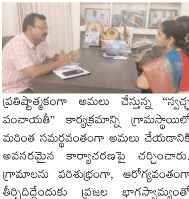
ప్రతిష్ఠాత్మకంగా అమలు చేస్తున్న "స్వచ్ఛ పంచాయతీ" కార్యక్రమాన్ని గ్రామస్థాయిలో మరింత సమర్థవంతంగా అమలు చేయడానికి అవసరమైన కార్యాచరణపై చర్చించారు. గ్రామాలను పరిశుభ్రంగా, ఆరోగ్యవంతంగా తీర్చిదిద్దేందుకు ప్రజల భాగస్వామ్యంతో

సమర్థవంతంగా అమలు చేయడం, గ్రామాల్లో పారిశుధ్యతను కాపాడేందుకు అవసరమైన చర్యలు చేపట్టడం, వర్షాకాలాన్ని దృష్టిలో ఉంచుకుని తాగునీటి వనరులలో కోరోనేషన్ కార్యక్రమాలను పటిష్టంగా అమలు చేయడం వంటి అంశాలపై ప్రత్యేకంగా చర్చించారు. అదేవిధంగా గ్రామీణ ప్రాంతాల్లో ప్రజలకు స్వచ్ఛమైన తాగునీరు అందించేందుకు చేపట్టాల్సిన చర్యలు, తాగునీటి సమస్యలను త్వరితగతిన పరిష్కరించే విధానాలపై సమీక్షించారు. అలాగే కేంద్ర మరియు రాష్ట్ర ప్రభుత్వాల