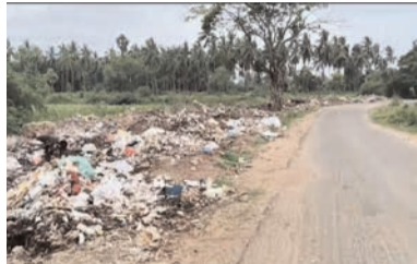
అని పలువురు వాహనదారులు వాపోతున్నారు. చెత్తను రోడ్డు మార్జిన్లపై కాకుండా ఊరికి దూరంగా డంపింగ్ యార్డు ఏర్పాటు చేసి తరలించాలని, తక్షణమే రోడ్డు పక్కనే ఉన్న చెత్త కుప్పలను తొలగించి వాహనదారుల ఇబ్బందులను తీర్చాలని ప్రగడవరం గ్రామ ప్రజలు, ప్రయాణికులు పంచాయతీ ఉన్నతాధికారులను కోరుతున్నారు.