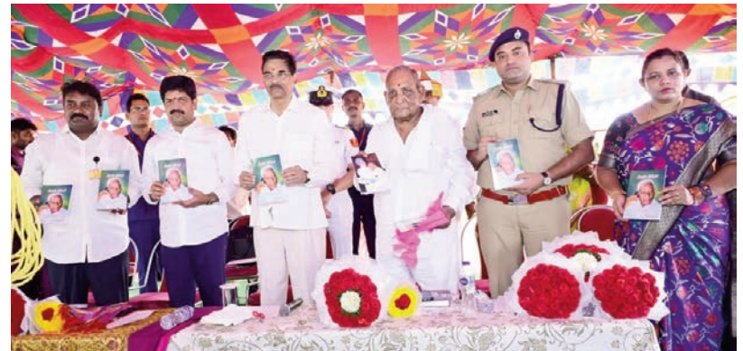
అభివృద్ధి కార్యక్రమాలకు శంకుస్థాపనలు, ప్రారంభోత్సవం చేసిన గవర్నర్

అభివృద్ధి కార్యక్రమాలకు మిస్సితంగా అందుబాటు లోకి రావడం సంతోషకరమని పేర్కొన్న గవర్నర్, గ్రామాభివృద్ధికి సమాజంలోని ప్రతి ఒక్కరూ భాగస్వాములు కావాలని పిలుపునిచ్చారు. గ్రామం పట్ల అనుబంధాన్ని కొనసాగిస్తూ అభివృద్ధికి కృషి చేస్తున్న దాతలు, గ్రామ పెద్దలను ఆయన ప్రత్యేకంగా అభినందించారు. పదే