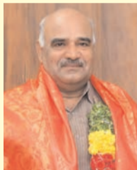
ప్రజాభూమి ప్రతినిధి-ఏలూరు జిల్లా