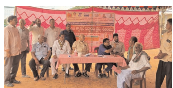
ప్రజాభూమి ప్రతినధి - ఆగిరిపల్లి