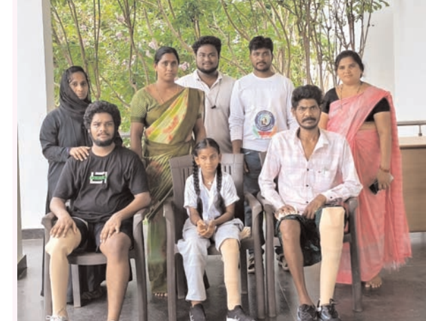
ప్రజాభూమి ప్రతినధి - తాళ్లపూడి