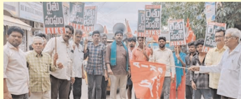
ప్రజాభూమి ప్రతినిధి-ఏలూరు జిల్లా

-జూలై 3న రైతుల బహిరంగ సభను జయిస్తూ చేయండి.