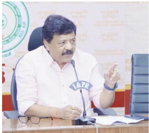
అధికారం పోయినా అపారంకారం పోలేదు. మార్కెటింగ్ రాజధాని కాదు, మొండి వైఖరి.

మాజీ సీఎం జగన్ మోహన్ రెడ్డి 'మావిగన్' వ్యాఖ్యలపై రాష్ట్ర పర్యాటక, సాంస్కృతిక, సినిమాటిగ్రఫీ శాఖ మంత్రి కందుల దుర్గేష్ తీవ్ర ఆగ్రహం