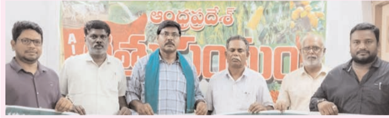
ప్రజా భూమి ప్రతినిధి-ఏలూరు

-రైతు సంఘం రాష్ట్ర మహాసభల ప్రవార క్లాత్ బ్యానర్ల అవిష్కరణ