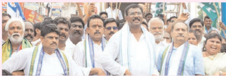
ప్రజా భూమి ప్రతినిధి-ఏలూరు

ఏలూరులో వైఎస్సార్ కాంగ్రెస్ పార్టీ భారీ ర్యాలీ