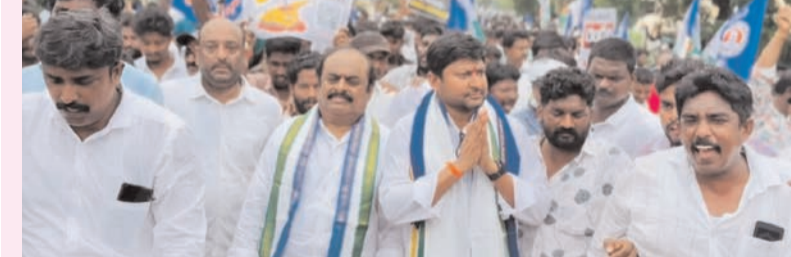
ప్రజా భూమి ప్రతినిధి-దెందులూరు

వెన్నుపోటుకు రెండేళ్లు కార్యక్రమంలో భారీ నిరసన ర్యాలీ