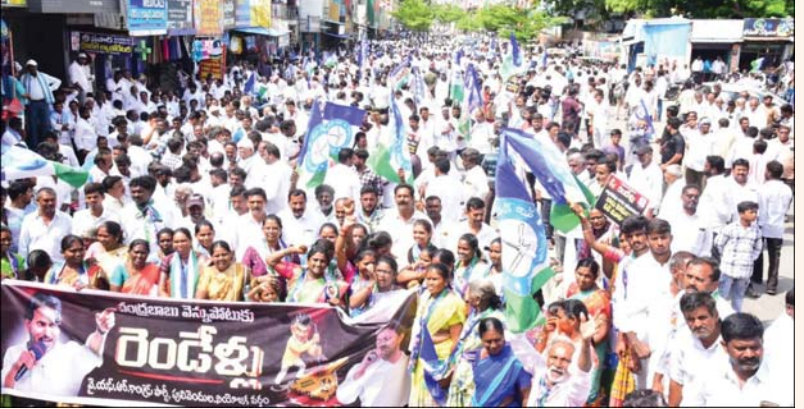
అతలాకుతం చేసిన మోసా తుపాసుకు లక్షల ఎకరాల వంట దెబ్బతిందని, ఇప్పటి వరకు వారికి సంక్షేమ పథకాలు అందించిన గొప్ప నాయకులు కనీసం సబ్సిడీలు కూడా అందించలేని పరిస్థితిలో చంద్రబాబు ప్రభుత్వం ఉందని వారన్నారు. చంద్రబాబు ప్రభుత్వంలో నిత్యపనర సరుకుల ధరలు ఆకాశమంటాయన్నారు. రాష్ట్రంలో వండించిన పంటలకు గిట్టుబాటు ధరలు లేక రైతులు అవ్వలను పడుతుంటే పట్టించుకోనే నాణ్యత కరువయ్యారన్నారు. ఆరోగ్య శ్రీని అటకెక్కించారన్నారు. జగన్ నన్ను హయాంలో రాష్ట్రంలో 17 ప్రభుత్వ మెడికల్ కళాశాలలను తీసుకొచ్చి వాటిని ప్రైవేటు వ్యక్తులకు అప్పగించే దుకు కుట్రలు చేస్తున్నారని వారు మండిపడ్డారు. 50 సంవత్సరాల వేసవి వచ్చి వేసవి వెన్నుపోటు అమలు చేస్తామని ఏ ఏడాదికి రూ.20 వేలు ఇస్తామని చెప్పిన చంద్రబాబు రైతులను నట్టేట ముంచారని వారన్నారు. జగన్ నన్ను పాలనలో రైతులకు ఉచిత బీమా పథకాన్ని అమలు చేశారని వారు గుర్తు చేశారు. ఇప్పుడు రైతుల ప్రీమియం చెల్లించాల్సి వస్తుందని, ఇది రైతులకు భారంగా మారిందని వారు మండిపడ్డారు. రాష్ట్రాన్ని