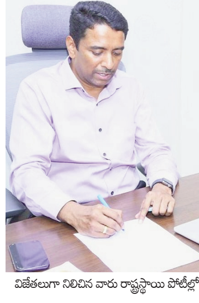
విజేతలుగా నిలిచిన వారు రాష్ట్రస్థాయి పోటీల్లో

ప్రజాభూమి ప్రతినిధి, విజయవాడ: సమాజంలోని ప్రతి వర్గానికి యోగా పట్ల అవగాహన కల్పించడం, ఆరోగ్యకరమైన జీవన శైలిని ప్రోత్సహించడం లక్ష్యంగా ప్రభుత్వం నిర్వహించే యోగాంధ్ర-2026లో భాగంగా ఈ నెల 7 నుంచి యోగా పోటీలు జరగనున్నట్లు జిల్లా కలెక్టర్ డా. జి.ఎ.ఎ. శనివారం ఒక ప్రకటనలో తెలిపారు. ఈ పోటీల్లో ప్రజలు పెద్దఎత్తున పాల్గొని విజయవంతం చేయాలని కోరారు. ఈ నెల 7 నుంచి 9వ తేదీ వరకు గ్రామ/పార్కు స్థాయిలో యోగా ఫర్ ఆల్ - గ్రామీనాల్కు వెల్సన్ ఇతివృత్తంలో పోటీలు నిర్వహించనున్నట్లు తెలిపారు. జిల్లా పోటీలకు స్వర్ణ గ్రామం, స్వర్ణ వార్డు కార్యాలయాల్లో రిజిస్ట్రేషన్ చేసుకోవాలని సూచించారు. గ్రామస్థాయిలో విజేతలు మండల స్థాయికి, మండలస్థాయిలో విజేతలు జిల్లాస్థాయికి, అక్కడ