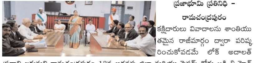
ప్రజాభూమి ప్రతినధి - కొత్తపేట

ప్రజాభూమి ప్రతినధి - కొత్తపేట ఈ నెల 28న నిర్వహించనున్న పల్నే పోలియో కార్యక్రమాన్ని విజయవంతం చేయడానికి రావులపాలెం మండలంలో మన్యత విధిస్తూ చేపట్టారు. ఈ నేపథ్యంలో మండల అభివృద్ధి అధికారి (ఎంపీడి), ఆధ్వర్యంలో గోపాలపురం, ఉబలంక ప్రాథమిక ఆరోగ్య కేంద్రాలు (పీహెచ్సీ) వైద్యాధికారులు, మండల విద్యాశాఖ అధికారులు (ఎంకేఓ-1, ఎంకేఓ-2)తో సమీక్ష సమావేశం నిర్వహించారు. సమావేశంలో పల్నే పోలియో కార్యక్రమం అమలు విధానం, పిల్లలకు పోలియో చుక్కలు అందించే విధానం, ప్రజల్లో అవగాహన కల్పించాల్సిన చర్యలపై విస్తృతంగా చర్చించారు. గోపాలపురం పీహెచ్సీ పరిధిలో 17 పోలియో కేంద్రాలు, ఉబలంక పీహెచ్సీ పరిధిలో 23 కేంద్రాలు ఏర్పాటు చేయగా, మండల వ్యాప్తంగా మొత్తం 40 పల్నే పోలియో కేంద్రాలను ఏర్పరచేసినట్లు అధికారులు తెలిపారు. కార్యక్రమం విజయవంతం కావడానికి గ్రామాల్లో మన్యత ప్రచారం చేపట్టి, ఐడెన్టిఫై చేసిన పిల్లల తల్లిదండ్రులకు పల్నే పోలియో టేబి, కేంద్రాల వివరాలు తెలియజేయాలని అన్ని పంచాయతీ అభివృద్ధి అధికారులకు (పిడిఓలు) సూచించినట్లు ఎంపీడి తెలిపారు. ప్రతి ఐడెన్టిఫై చేసిన పిల్లలకు పోలియో చుక్కలు వేయించి, పోలియో రహిత సమాజ నిర్మాణానికి ప్రజలు సహకరించాలని అధికారులు విజ్ఞప్తి చేశారు. కార్యక్రమంలో వైద్య, విద్యాశాఖ అధికారులు, సంబంధిత సిబ్బంది పాల్గొన్నారు.