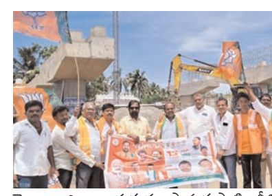
ప్రజాభూమి ప్రతినధి - కొత్తపేట