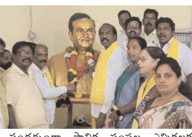
ప్రజాభూమి ప్రతినధి - ఏలూరు

ప్రజాభూమి ప్రతినధి - ఏలూరు స్థానిక సంస్థల ఎన్నికల్లో జిల్లాలోని అన్ని స్థానాలను కూటమి కైవసం చేసుకోవడమే లక్ష్యంగా వక్కా పువ్వలతో ముందుకు సాగుతున్నామని జిల్లా తెలుగుదేశం పార్టీ అధ్యక్షుడు, ఏలూరు ఎమ్మెల్యే బండేటి చంటి తెలిపారు.