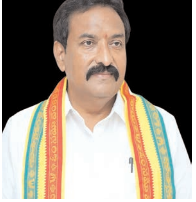
ప్రజాభూమి ప్రతినధి - కొత్తపేట

కొత్తపేట ఎమ్మెల్యే బండారు కృషికి హర్షం వ్యక్తం చేస్తున్న దేవాలయాల నిధులు.