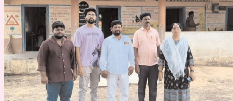
ప్రజా భూమి ప్రతినిధి-ఏలూరు