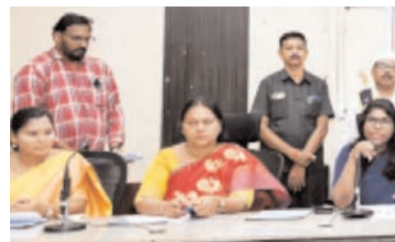
మూడు గ్రామాలకు సోలార్ విద్యుత్ సౌకర్యం కల్పించామని అన్నారు. గిరిజన ప్రాంతంలో విద్యుత్తులు తక్కువగా ఉన్న యువతకు వైపు బ్యాంకింగ్ కార్యక్రమాలు నిర్వహించి వారికి ఉపాధి కల్పించేందుకు తగు ప్రణాళిక సిద్ధం చేశామన్నారు. సర్వేయర్లకు పనులపంపానికి రుణాలు కోరిన గిరిజనులకు ఈ ఆర్థిక సహాయం అందించేందుకు ప్రణాళిక సిద్ధం చేశామన్నారు. గో.రాష్ట్ర ముఖ్యమంత్రి చెప్పిన విధంగా ఉపాధి కల్పించేందుకు ప్లాన్ ఆఫ్ యాక్షన్ సిద్ధం చేస్తున్నామన్నారు. పోలవరం ప్రాజెక్ట్ ఆర్ అండ్ ఆర్ కు సంబంధించి ఏవైనా సమస్యలుంటే వాటిని విచారణ చేసి వాటిని పరిష్కరిస్తున్నామన్నారు. గిరిజన ప్రాంతం