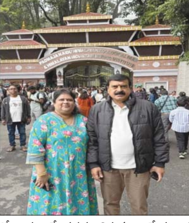
దోబామలూడే పర్వపు చినుకులు మేఘాలను చీల్చుకుంటూ సాగే రహదారుల వెంట కనువిందు