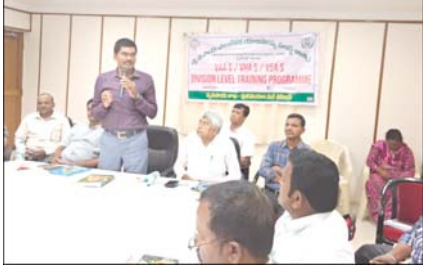
ప్రజాభూమి, పులివెందుల వ్యవసాయ శాఖ సిబ్బంది రైతులకు అందుబాటులో ఉంటూ ఈ పంట నమోదు ఎరువుల పంపిణీ కొరత, శిక్షణ కార్యక్రమాలను నిర్వహించారు.

ప్రజాభూమి, పులివెందుల వ్యవసాయ శాఖ సిబ్బంది రైతులకు అందుబాటులో ఉంటూ ఈ పంట నమోదు ఎరువుల పంపిణీ పారదర్శకంగా నిర్వహించాలని వ్యవసాయ సహాయ సంచాలకులు ప్రభాకర్ రెడ్డి అన్నారు. శుక్రవారం పట్టణంలోని రోడ్డు, భవనాల శాఖ అతిథి గృహం సమావేశ మందిరంలో రైతు సేవా కేంద్రాల సిబ్బందికి ఈ పంట నమోదు మరియు పారదర్శక ఎరువుల పంపిణీ కొరత, శిక్షణ కార్యక్రమాలను నిర్వహించారు. ఈ కార్యక్రమంలో పులివెందుల వ్యవసాయ సహాయ సంచాలకులు ప్రభాకర్