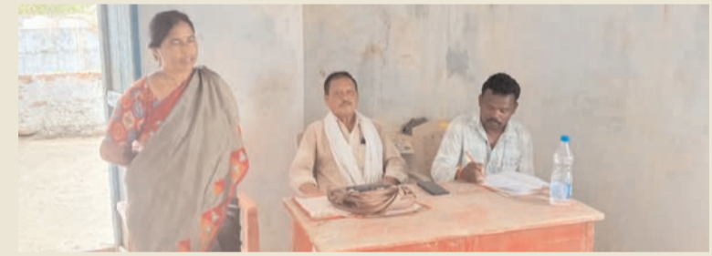
ప్రజా భూమి ప్రతినధి-కూనపరం