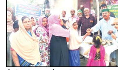
మిలియాల బాబా గౌసీయా ఆశ్రమంలో అంగరంగ వైభవంగా, వీర్ల పండ్లగ వేడుకలు