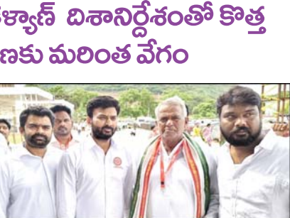
జనసేన అధ్యక్షులు పవన్ కళ్యాణ్ దిశానిర్దేశంతో కొత్త కమిటీ కార్యచరణకు మరింత వేగం

ప్రజాభూమి ప్రతినిధి: శ్రీకాళహస్తి మంగళగిరిలోని సీక్ కన్వెన్షన్ లో నిర్వహించిన "జనసేన సారథుల సమాచార సేకరణ కమిటీ కార్యచరణ సమావేశం"లో జనసేన పార్టీ అధ్యక్షులు పవన్ కళ్యాణ్ కమిటీ సభ్యులు, పార్టీ సారథులు, కార్యకర్త