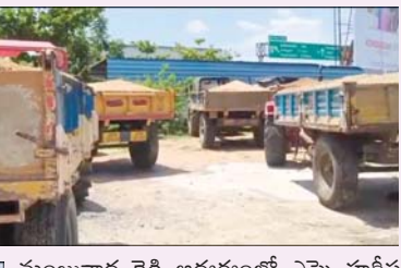
ఇసుక అక్రమ తవ్వకాలపై, గాజుల ముగ్గుం పోలీసుల, ఉక్కు పాదం

ప్రజాభూమి ప్రతినిధి రేణిగుంట, రేణిగుంట మండలం (రూరల్) గాజుల ముగ్గుం పరిసర ప్రాంతాల్లో శనివారం ఉదయం పోలీసులు మరియు రెవెన్యూ శాఖ అధికారులు ఇసుక అక్రమ రవాణా చేస్తున్న వాహనాలపై దాడులు నిర్వహించి వాహనాలను స్వాధీనం చేసుకున్నారు. సీబి