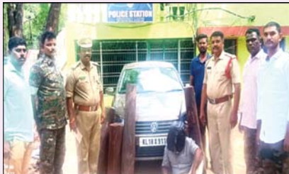
తిరుపతి జిల్లా రేణిగుంట - చెన్నై మార్గంలో చేపట్టిన తనిఖీల్లో కారులో తరలిస్తున్న 5 ఎర్రచందనం దుంగలను స్వాధీనం చేసుకుని కారును టాస్క్ ఫోర్స్ పోలీసులు సీజ్ చేశారు.