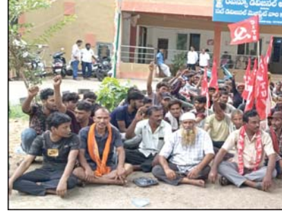
పుష్పిత పరిశ్రమలో వేతనాల ఎగవేత రోడ్లకి వచ్చిన కార్మికులు పలువురి నిర్బంధం