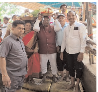
ప్రజా భూమి ప్రతినది - బుట్టూరుగూడెం