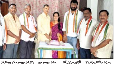
వహిస్తున్నారని అన్నారు. దేశంలో నిరుద్యోగం, ధరల పెరుగుదల వంటి సమస్యలు పెరుగుతున్నాయని విమర్శించారు. దేశ, రాష్ట్ర శ్రేయస్సు కోసం రాహుల్ గాంధీ నాయకత్వంలో కాంగ్రెస్ పార్టీ బలోపేతం కావాలని, ప్రతి కాంగ్రెస్ పార్టీ కార్యకర్తలకు ప్రధానమంత్రి పదవిని త్యాగం చేసిన త్యాగశీలి అని పేర్కొన్నారు. ఆంధ్రప్రదేశ్ కు ప్రత్యేక చోదా, రాయలసీమ, ఉత్తరాంధ్ర ప్రాంతాలకు ప్రత్యేక అభివృద్ధి ప్యాకేజీ, కడప జిల్లాలో స్టీల్ ప్లాంట్, దుగరాజపట్నం ఓడరేవు వంటి అంశాలు నెరవేరాలంటే కాంగ్రెస్ పార్టీ అధికారంలోకి రావాలని అవసరం ఉందన్నారు. దేశంలో లౌకికవాదం, ప్రజాస్వామ్య పరిరక్షణ కోసం రాహుల్ గాంధీ నాయకత్వం