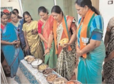
ప్రజా భూమి ప్రతినది - నూజివీడు