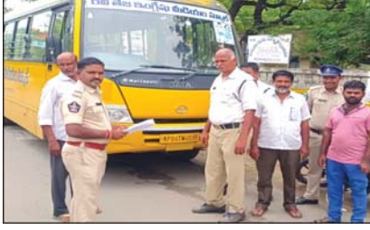
విద్యార్థుల భద్రతను దృష్టిలో ఉంచుకుని రోడ్డు భద్రతా నియమాలు తప్పకుండా పాటించాలి న్నారు. ముఖ్యంగా విద్యార్థులను బస్సుల్లో ఎక్కించే సమయంలో, అలాగే దింపే సమయంలో అత్యంత