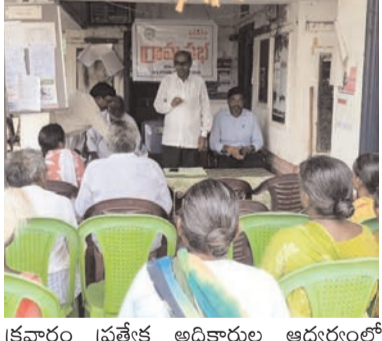
ప్రజా భూమి ప్రతినది - ఆగిరిపల్లి