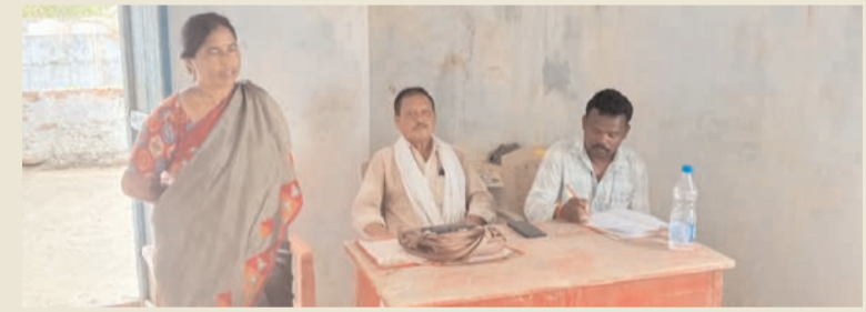
ప్రజా భూమి ప్రతినది-కూనపరం