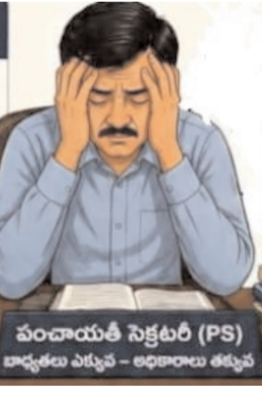
పంచాయతీ సెక్టరీ (PS) కార్యాలయ ఎగ్జిక్యూటివ్ - అధికారులు తప్పు

పాత పద్ధతిలోనే చెల్లింపులు జరగాలి గతంలో ప్రత్యేక అధికారి హోదాలో చెక్కులు మార్చడానికి వీలు ఉండేది. ఇప్పుడు చేసిన పనులకు, కొందరు జీతాలు తీసుకోవడానికి డిఎల్ పి ఓ, డి పి ఓ అప్రూవల్ కావాలని ఉండడంతో గ్రామాల్లో అభివృద్ధి పనులకు అటంకం కలుగుతుందని పలువురు అంటున్నారు. కొంతమంది సిబ్బంది జీతాలు కూడా ఆరు నెలలకు పైబడి ఇవ్వకపోవడంతో సిబ్బంది గ్రామాల్లో అభివృద్ధి పనులు చేయడానికి రావడం లేదని మరికొందరు అంటున్నారు. కావున గతంలో మాదిరిగా పాత పద్ధతిలోనే గ్రామాల్లో అభివృద్ధి పనులకు, సిబ్బంది జీతాలు చెల్లించడానికి చర్యలు తీసుకోవాలని ప్రభుత్వాన్ని కోరుతున్నారు.