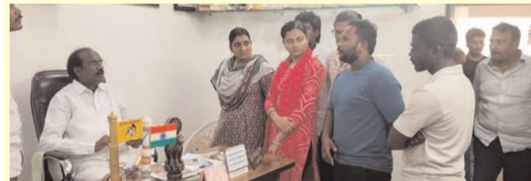
ప్రజా భూమి ప్రతినిధి-వీలూరు

ప్రజా సమస్యల పరిష్కారానికి రాష్ట్ర ప్రభుత్వం అత్యంత ప్రాధాన్యత ఇస్తోందని, తన దృష్టికి వచ్చిన ప్రతి సమస్యను అధికారుల దృష్టికి తీసుకెళ్లి పరిష్కరించేందుకు చర్యలు తీసుకుంటున్నట్లు వీలూరు ఎమ్మెల్యే బడేటి చందీ తెలిపారు. శనివారం వీలూరులోని ఎమ్మెల్యే క్యాంపు కార్యాలయంలో నిర్వహించిన ప్రజా వినతుల స్వీకరణ కార్యక్రమంలో ఆయన వివిధ ప్రాంతాల నుండి వచ్చిన ప్రజల సమస్యలను విన్నారు. ప్రతి వినతిని పరిశీలించి, సంబంధిత అధికారులకు తగిన ఆదేశాలు జారీ చేసిన ఎమ్మెల్యే, ప్రజల ఎలాంటి సమస్య ఉన్నా తన దృష్టికి తీసుకురావాలని సూచించారు. ప్రజా సంక్షేమమే లక్ష్యంగా ప్రభుత్వం పనిచేస్తోందని, అన్ని వర్గాల అభ్యుత్థికి సంక్షేమ పథకాలను సమర్థవంతంగా అమలు చేస్తున్నట్లు పేర్కొన్నారు. కార్యక్రమంలో తెలుగుదేశం పార్టీ నాయకులు, కార్యకర్తలు పాల్గొన్నారు.