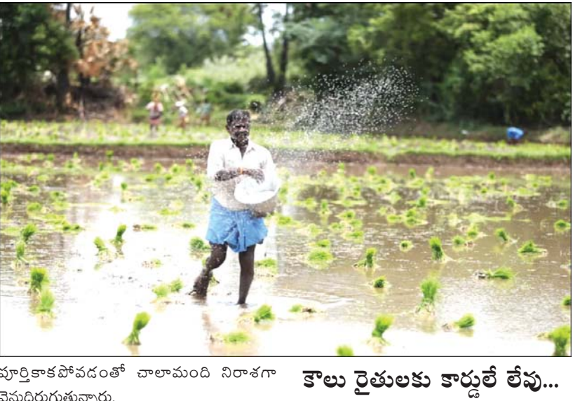
పూర్తికాకపోవడంతో చాలామంది నిరాశగా వెనుదిరుగుతున్నారు.

ప్రజాభూమి, హిందూపురం టౌన్ వానలు కురిసి ఖరీఫ్ సాగు జోరందుకుంటున్న వేళ ఉమ్మడి అనంతపురం జిల్లా రైతాంగం మరోసారి ఎరువుల కష్టాల్లో చిక్కుకుంది. పొలంలో విత్తనం వేయడానికి సిద్ధమైన రైతు ఇప్పుడు ఎరువు బస్తా కోసం దుకాణాల చుట్టూ తిరగాల్సిన పరిస్థితి ఏర్పడింది. చేతిలో డబ్బు ఉన్నా ఎరువు దొరకని దుస్థితి నెలకొంది. యాప్ అనుమతిస్తేనే బస్తా.. లేదంటే నిరాశతో వెనుదిరగాల్సిందే. ఒక్కప్పుడు అవసరమైనన్ని బస్తాలు కొనుగోలు చేసిన రైతులు ఇప్పుడు యాప్ కేటాయించిన ఒకటి, రెండు బస్తాల కోసం గంటల తరబడి క్యూల్లో నిలబడుతున్నారు. యాప్ దే రాజ్యం... రైతు అవసరాలకు విలువ లేదా...! ప్రస్తుతం రాష్ట్ర ప్రభుత్వం అమలు చేస్తున్న ఎరువుల పంపిణీ విధానంలో యాప్ దే తుది నిర్ణయం. రైతు ఆధారం నంబర్ సమూహ చేసిన పోటన్ వెబ్సైట్లో వివరాలు, యూరియా, గత ఖరీఫ్ సాగు చేసిన పంటలు, భూమి విస్తీర్ణం వంటి సమాచారం తెరపై కనిపిస్తుంది. వాటి ఆధారంగానే రైతుకు ఎంత ఎరువు ఇవ్వాలో యాప్ నిర్ణయిస్తోంది. రైతు ప్రస్తుతం ఏ పంట సాగు చేస్తున్నాడన్నది వక్కపెట్టి గత ఏడాది సమూహం పంటల ఆధారంగా కోటా కేటాయిస్తుందంటే అనేక మంది రైతులు తీవ్ర ఇబ్బందులు ఎదుర్కొంటున్నారు. ఒకేసారి మొత్తం కోటా ఇవ్వకుండా రెండు, మూడు విడతలుగా విభజించి చూపుతుండటంతో రైతులకు అవసరమైన సమయంలో అవసరమైన ఎరువులు అందడం లేదు.