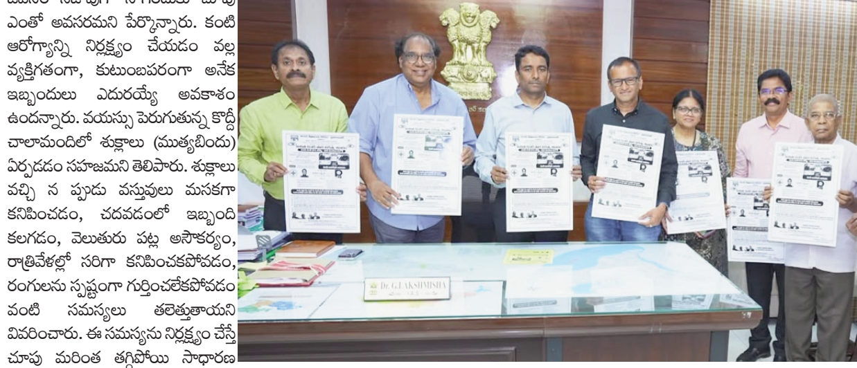
జీవనం సజావుగా సాగేందుకు చూపు ఎంతో అవసరమని పేర్కొన్నారు. కంటి ఆరోగ్యాన్ని నిర్లక్ష్యం చేయడం వల్ల వ్యక్తిగతంగా, కుటుంబపరంగా అనేక ఇబ్బందులు ఎదురయ్యే అవకాశం ఉందన్నారు. వయస్సు పెరుగుతున్న కొద్దీ చాలామందిలో శుక్లాలు (ముత్యబిందు) ఏర్పడడం సహజమని తెలిపారు. శుక్లాలు వచ్చినప్పుడు చూపులకు మనకగా కనిపించడం, చదవడంలో ఇబ్బంది కలగడం, వెలుతురు పట్ల అసౌకర్యం, రాత్రివేళల్లో సరిగా కనిపించకపోవడం, రంగులను స్పష్టంగా గుర్తించలేకపోవడం వంటి సమస్యలు తలెత్తతాయని వివరించారు. ఈ సమస్యను నిర్లక్ష్యం చేస్తే చూపు మరింత తగ్గిపోయి సాధారణ జీవనం కూడా కష్టతరమయ్యే పరిస్థితి ఏర్పడుతుందని హెచ్చరించారు. శుక్లాలు ప్రస్తుతం అత్యంత సురక్షితమైన, సమర్థవంతమైన చికిత్స శస్త్రచికిత్సేనని కలెక్టర్ తెలిపారు. శస్త్రచికిత్స ద్వారా మనకభారిన కంటి తెప్పేను తొలగించి, దాని స్థానంలో కృత్రిమ లెన్స్ ను అమర్చడం వల్ల చూపు గణనీయంగా మెరుగుపడుతుందని చెప్పారు. శుక్లాలు శస్త్రచికిత్స వల్ల కలిగే ప్రధాన ప్రయోజనాలు: చూపు స్పష్టంగా, మెరుగ్గా కనిపించడం. చదవడం, నడవడం, బెలివిజన్ చూడడం వంటి పనులు సులభంగా చేయగలగడం. స్వయం ఆధారిత జీవనం కొనసాగించే అవకాశం పెరగడం. పడిపోవడం, ప్రమాదాలకు గురయ్యే అవకాశాలు తగ్గడం. అత్యవస్యాసం, జీవన నాణ్యత పెరగడం. కుటుంబ సభ్యులపై ఆధారపడే అవసరం తగ్గడం. ప్రభుత్వ ఆసుపత్రుల్లో కంటి పరీక్షలు, శుక్లాలు శస్త్రచికిత్సలు నిపుణులైన వైద్యుల పర్యవేక్షణలో