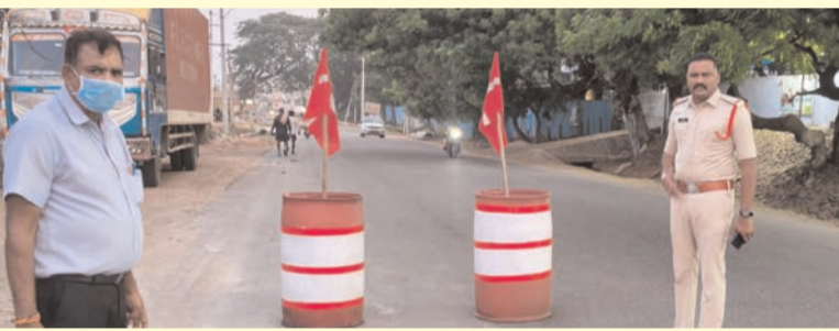
ప్రజా భూమి ప్రతినిధి-ఆగిరిపల్లి

-నెక్కలం-గొల్లగూడెం రహదారిపై ట్రాఫిక్ డ్రమ్ముల ఏర్పాటు