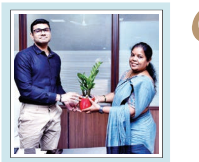
న్యూఢిల్లీలోని ఏపీఐసీ ప్రత్యేక అధికారిగా

2 ప్రజాభూమి ప్రతినిధి, శ్రీకాకుళం : ఉత్తరాంధ్ర ప్రజల చిరకాల కోరిక.. రైల్వే జోన్ సాకారమైందని కేంద్ర మంత్రి రామ్మోహన్ నాయుడు అన్నారు. అన్నో, పోరాటాల ఫలితమే దక్షిణ కోస్తా రైల్వే లని తెలిపారు. విశాఖ రైల్వేజోన్ ఏర్పాటుపై ఇచ్చాపురం రైల్వేస్టేషన్ వద్ద నిర్వహించిన సంబరాలలో ఆయన పాల్గొన్నారు. ఈ సందర్భంగా ఆయన మాట్లాడుతూ, కొత్త జోన్ ఏర్పాటుతో లక్షలమంది ప్రయాణికులకు లబ్ధి చేకూరుతుందన్నారు. రైల్వేను అభివృద్ధి చేస్తే ఉత్తరాంధ్ర అభివృద్ధి చెందుతుందన్న ఉద్దేశంతోనే కృషి చేసినట్లు చెప్పారు. - మిగతా 2లో..