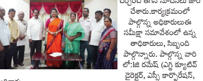
మచిలీపట్నం, కృష్ణాజిల్లా) ఎన్నీ కార్పొరేషన్ కు సంబంధించిన ఇతర ముఖ్య అధికారులు, సిబ్బంది పాల్గొన్నారు.