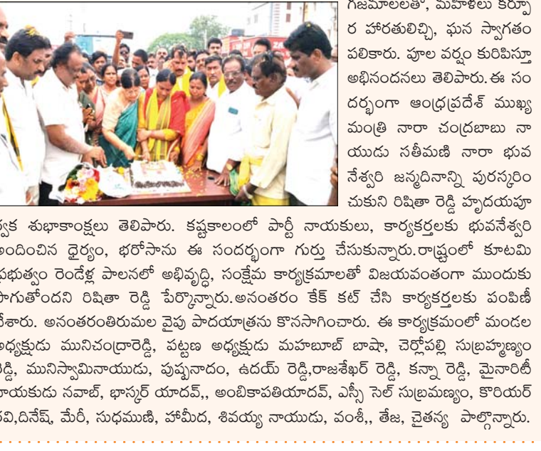
ప్రజా భూమి ప్రతినిధి రేణిగుంట