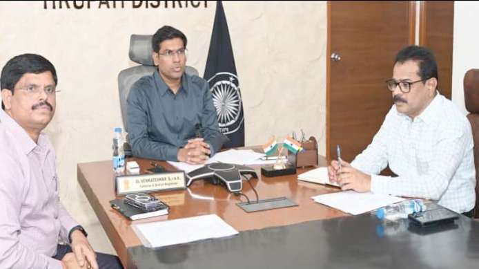
ప్రజా భూమి ప్రతినిధి, తిరుపతి,