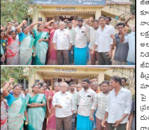
ప్రజా భూమి ప్రతినిధి సత్యవేడు