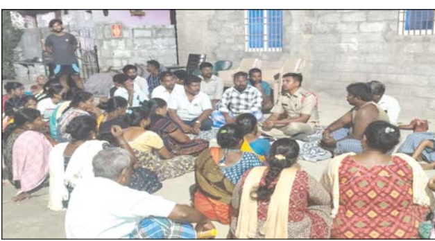
ప్రజా భూమి ప్రతినిధి చిత్తూరు