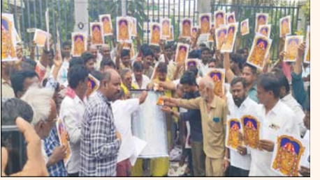
ప్రజా భూమి ప్రతినిధి తిరుపతి

ప్రజా భూమి ప్రతినిధి తిరుపతి “ఏడుకొండలవాడా వెంకటరమణా గోవిందా గోవిందా మా బాధలు తీర్చండి అంటూ దైవర్షుల వినుత్య రీతిలో నిరసన వ్యక్తం చేశారు. శ్రీ వెంకటేశ్వర స్వామి చిత్రపటానికి పాలాభిషేకం నిర్వహించి తమ ఆవేదనను తెలియజేశారు. తిరుమలలో ఏడుగురు నిర్వహిస్తున్న కొందరు దైవర్షుల వాచనాలపై నెలల తరబడి నిషేధాజ్ఞలు విధిస్తున్నారని వారు ఆరోపించారు. చిన్నచిన్న కారణాలతో వాచనాలను నిలిపివేస్తూ తమ జీవనోపాధిపై తీవ్ర ప్రభావం చూపుతున్నారని వాపోయారు. ఈ సందర్భంగా వెంకటేశ్వర స్వామి చిత్రపటాలను చేతబట్టి నిరసన ప్రదర్శన చేపట్టారు. సమస్యల పరిష్కారం కోసం అధికారులను సంప్రదించి, “తిరుమల ఈసోను సంప్రదించండి” అని మాత్రమే చెబుతున్నారని తెలిపారు. “మా స్వామి దైవర్షుల ఈవోను నేరుగా కలిపి అవకాశం ఎక్కడుంది? సీసీ (టీఫ్ కన్వల్షన్/సంబంధిత ఉన్నతాధికారిని సంప్రదించే స్థాయిలో మేమున్నామా?” అంటూ దైవర్షులు ఆవేదన వ్యక్తం చేశారు. తమ సమస్యలను అధికారులు మానవతా దృక్పథంతో పరిశీలించి, వాచనాలపై విధించిన నిషేధాలను పునఃమీక్షించి న్యాయం చేయాలని వారు కోరారు. సమస్యలు పరిష్కరించకపోతే తమ ఆందోళనను మరింత ఉధృతం చేస్తామని హెచ్చరించారు.