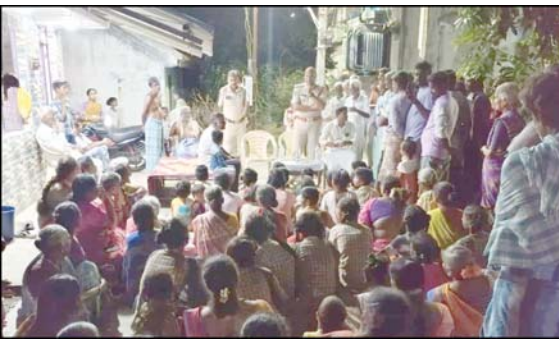
ప్రజా భూమి ప్రతినిధి చిత్తూరు