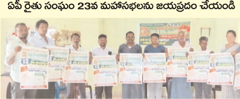
పవీ రైతు సంఘం 23వ మహాసభలను జయప్రదం చేయండి