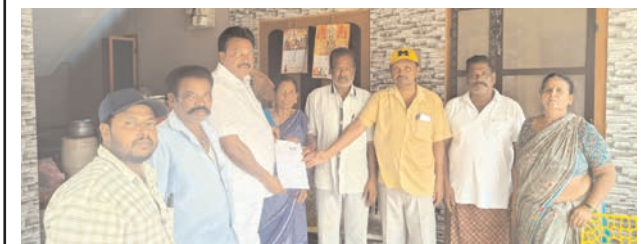
ప్రజాభూమి ప్రతినిధి - చాట్రాయి