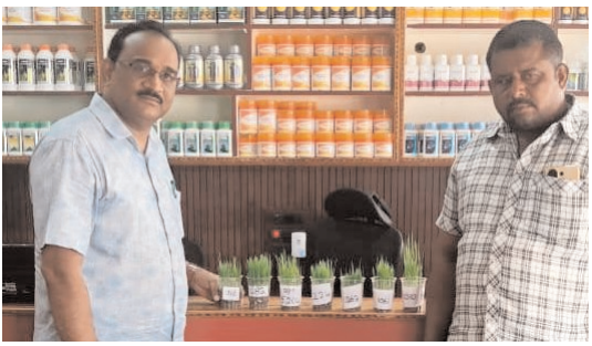
ప్రజాభూమి ప్రతినిధి - చాట్రాయి వరి సాగు చేసే రైతులు వరి విత్తనాలను కొనేటప్పుడు షాపు