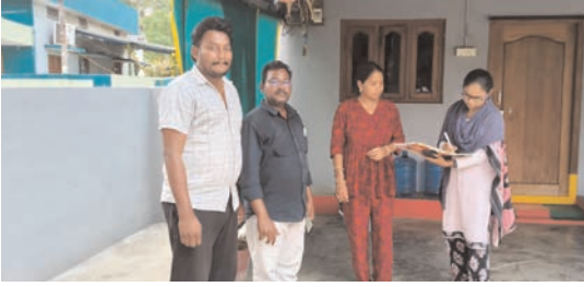
ప్రజాభూమి ప్రతినిధి - కూనవరం