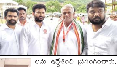
పవన్ కళ్యాణ్ కమిటీ సభ్యులను ప్రసంగించారు.