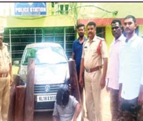
రేణిగుంట - చెన్నై మార్గంలో టాస్క్ ఫోర్స్ పోలీసులు కారును సీజ్ చేశారు.