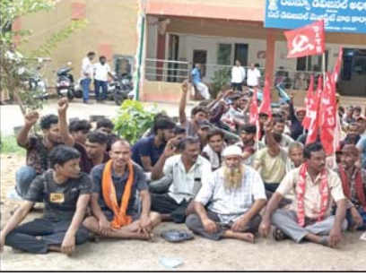
పుష్పిత స్టీల్ పరిశ్రమలో కార్మికులు నిరసనగా విధులను బహిష్కరించారు.