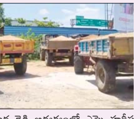
గాజుల ముగ్గుం వద్ద పోలీసులు ట్రాక్టర్లను సీజ్ చేశారు.

ప్రజాభూమి ప్రతినిధి రేణిగుంట. రేణిగుంట మండలం (రూరల్) గాజుల ముగ్గుం వరసర ప్రాంతాల్లో శనివారం ఉదయం పోలీసులు మరియు రెవెన్యూ శాఖ అధికారులు ఇసుక అక్రమ రవాణా చేస్తున్న వాహనాలపై దాడులు నిర్వహించి వాహనాలను స్వాధీనం చేసుకున్నారు. సీబి మంజునాథ రెడ్డి అధ్యక్షులలో ఎన్నె వారిష పోలీస్ సిబ్బంది కి వచ్చిన సమాచారం మేరకు ఈ దాడులు నిర్వహించినట్లు అధికారులు తెలిపారు. కొద్ది మంగళం గ్రామం వరదీలోని (పైవేట్ నల్లం) అక్రమంగా ఇసుక నిల్వచేసి అక్రమ నుండి తరలిస్తున్న 10 ట్రాక్టర్లను స్వాధీనం చేసుకున్నారు. మరోక బృందం పిల్ల పాలెం సమీపంలో ఇసుక తవ్వకాలకు వినియోగిస్తున్న జెసిబి నాలుగు ట్రాక్టర్లను సీజ్ చేశారు. అక్రమ ఇసుక రవాణా చేస్తున్న వ్యక్తులపై కేసులు సమూహం చేసి చట్టపరమైన చర్యలు తీసుకుంటామని తెలిపారు. అక్రమ ఇసుక రవాణా జరిగితే ప్రజలు పోలీసులకు మరియు రెవెన్యూ అధికారులకు సమాచారం ఇవ్వాలని తెలిపారు.