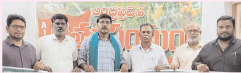
ప్రజా భూమి ప్రతినిధి-ఏలూరు