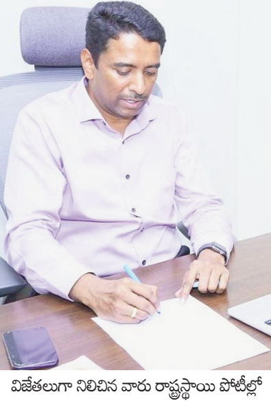
విజేతలుగా నిలిచిన వారు రాష్ట్రస్థాయి పోటీల్లో

ప్రజాభూమి ప్రతినిధి, విజయవాడ: సమాజంలోని ప్రతి వర్గానికి యోగా పట్ల అవగాహన కల్పించడం, ఆరోగ్యకరమైన జీవన శైలిని ప్రోత్సహించడం లక్ష్యంగా ప్రభుత్వం నిర్వహించే యోగాంధ్ర-2026లో భాగంగా ఈ నెల 7 నుంచి యోగా పోటీలు జరగనున్నట్లు జిల్లా కలెక్టర్ డా. జి.ఎ.కృష్ణ శనివారం ఓ ప్రకటనలో తెలిపారు. ఈ పోటీల్లో ప్రజలు పెద్దఎత్తున పాల్గొని విజయవంతం చేయాలని కోరారు. ఈ నెల 7 నుంచి 9వ తేదీ వరకు గ్రామ/వార్డు స్థాయిలో యోగా ఫర్ ఆల్ - గ్రానోరూల్స్ వెల్సెన్ ఇతివృత్తంలో పోటీలు నిర్వహించనున్నట్లు తెలిపారు. జిల్లా పోటీలకు స్వర్ణ గ్రామం, స్వర్ణ వార్డు కార్యాలయాల్లో రిజిస్ట్రేషన్ చేసుకోవాలని సూచించారు. గ్రామస్థాయిలో విజేతలు మండల స్థాయికి, మండలస్థాయిలో విజేతలు జిల్లాస్థాయికి, అక్కడ