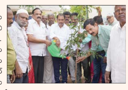
ప్రజాభూమి, హిందూపురం టౌన్ పర్యావరణ పరిరక్షణకు విరివిగా మొక్కలు నాటడం...