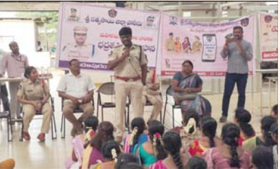
ప్రజాభూమి, హిందూపురం టౌన్ మహిళల భద్రత...