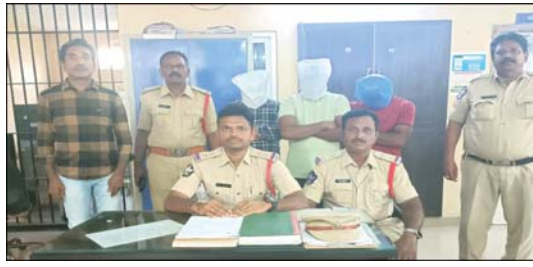
ప్రజాభూమి, ప్రతినిధి అనంతపురం ముగ్గురు అంతర్జిల్లా నిందితులు అరెస్ట్ చేసిన అనంతపురం టౌన్ పోలీసులు రూ. 1,35,000 నగలు, టైక్, 3 వెల్ ఫోన్లు స్వాధీనం ఒక లక్ష రూపాయల ఒరిజినల్ కరెన్సీ ఇన్సీ మూడు లక్షల నకిలీ నోట్లు ఇస్తాం అని, అలాగే "బ్యాక్ నోట్లను కెమికల్స్ ద్వారా ఒరిజినల్ నోట్లుగా మారుస్తాం" అంటూ ఆమాయక ప్రజలను నమ్మించి, వారిని నిర్ణయ ప్రదేశాలకు పిలిపించి దోపిడీలకు పాల్పడుతున్న ముగ్గురు సభ్యుల అంతర్జిల్లా మూలను శుక్రవారం ప్రతినిధి అనంతపురం టౌన్ పోలీసులు అత్యంత చాకచక్యంగా అరెస్ట్ చేశారు.