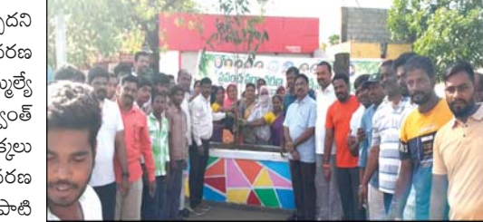
ప్రజాభూమి, ప్రతినిధి అనంతపురం మొక్కలు పెంచకపోతే భవిష్యత్ లో చాలా ప్రమాదాలు ఎదురొక తప్పదని అనంతపురం అర్బన్ ఎమ్మెల్యే దగ్గుపాటి ప్రసాద్ అన్నారు.

మంది మొక్కలు నాటుతున్నారు.. అయితే వాటి పరిరక్షణ గురించి వట్టింపుకోవడం లేదన్నారు. కేవలం మొక్కలు నాటి వదిలేస్తే ఎలాంటి ప్రయోజనం ఉండదన్నారు.