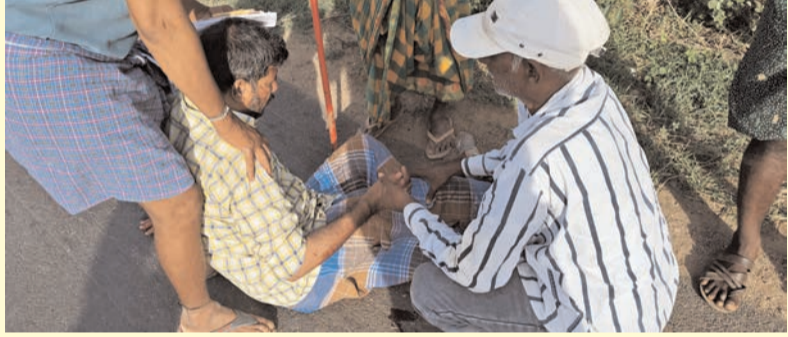
ప్రజా భూమి ప్రతినిధి-పోరుమామిళ్ల

కడప జిల్లా పోరుమామిళ్ల, కలసపాడు మండలం పరిధిలో గురువారం సాయంత్రం వేరువేరు రోడ్డు ప్రమాదం చోటుచేసుకుంది. మండలంలోని కాల్యకట్ట సమీపంలో వేగంగా వెళ్తున్న రెండు మోటార్ సైకిళ్లు ఒకదానికొకటి బలంగా ఢీకొన్నాయి. ఈ ప్రమాదంలో ఇద్దరు వ్యక్తులు తీవ్రంగా గాయపడ్డారు.