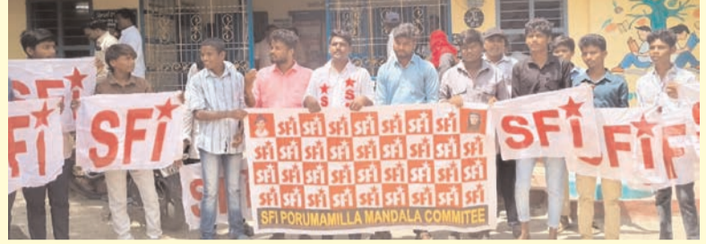
ప్రజా భూమి ప్రతినిధి-పోరుమామిళ్ల

అక్రమ సంపాదనకు పాల్పడుతున్న సంకల్ప కోచింగ్ సెంటర్ యాజమాన్యంపై చర్యలు తీసుకోవాలి ఎస్ఎఫ్ఐ.