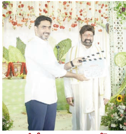
సినిమాలోగ్రఫీ మంత్రి కందుల దుర్గేశ్ ప్రజారాజధాని అమరావతిలో ప్రముఖ సినినటులు నందమూరి బాలకృష్ణ నటిస్తున్న 'NBK 112' చిత్రానికి ముఖ్య అతిథులుగా హాజరై ముహూర్తం పాఠానికి క్రాస్ కొట్టిన మంత్రులు నారా లోకేశ్, కందుల దుర్గేశ్ ఏపీలో చిత్ర పరిశ్రమ స్థిరపడడానికి

ఇదొక బలమైన పునాది అని పేర్కొన్న మంత్రి దుర్గేశ్ ఏపీలో స్టూడియోలు, లొకేషన్లు, రీలీజ్ కాలిబర్ థియేటర్ నిర్మాణం, సినిమా పరిశ్రమ అభివృద్ధికి సర్వశక్తులూ ఒడ్డుతాం: మంత్రి కందుల దుర్గేశ్ అమరావతి ప్రజాభూమి ప్రతినిధి పద్మభూషణ్ ప్రముఖ సినినటులు నందమూరి బాలకృష్ణ 112వ చిత్రం ప్రజారాజధాని అమరావతిలో ప్రారంభించుకోవడం ఆనందంగా ఉందని సినిమాలోగ్రఫీ మంత్రి కందుల దుర్గేశ్ అన్నారు. గురువారం వెంకటాయపాలెంలో ఏర్పాటు చేసిన 'NBK 112' చిత్రం ముహూర్తం వేడుకకు ముఖ్య అతిథులుగా సినిమాలోగ్రఫీ మంత్రి కందుల దుర్గేశ్, మంత్రి నారాలోకేశ్ లు హాజరయ్యారు. శాస్త్రోక్తంగా జరిగిన పూజా కార్యక్రమాల ఆనంతరం, మంత్రులు నారా లోకేశ్, కందుల దుర్గేశ్ లు స్పెషల్స్ చిత్ర బృందానికి అందించారు. ముహూర్తం పాఠానికి మంత్రులు క్రాస్ కొట్టి, కెమెరా స్విచ్ పాస్ చేయగా... మంత్రి దుర్గేశ్ 'యాక్ట్' చెప్పారు. ఈ సందర్భంగా