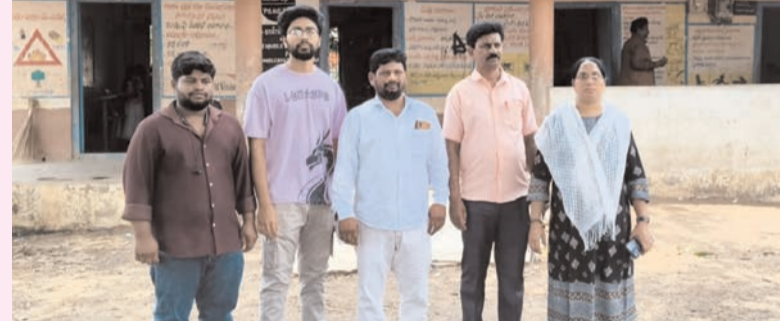
ప్రజా భూమి ప్రతినిధి-ఏలూరు