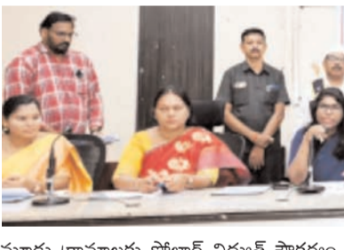
మూడు గ్రామాలకు సోలార్ విద్యుత్ సౌకర్యం కల్పించామని అన్నారు. గిరిజన ప్రాంతంలో విద్యుత్తులు తక్కువగా ఉన్న యువతకు వైపు బ్యాంకింగ్ కార్యక్రమాలు నిర్వహించి వారికి ఉపాధి కల్పించేందుకు తగు ప్రణాళిక సిద్ధం చేశామన్నారు. సర్వేయర్లకు పనులవసానికి రుణాలు కోరిన గిరిజనులకు ఈ ఆర్థిక సంవత్సరంలో రుణాలు అందించేందుకు ప్రణాళిక సిద్ధం చేశామన్నారు. గో.రాష్ట్ర ముఖ్యమంత్రి చెప్పిన విధంగా ఉపాధి కల్పించేందుకు ప్లాన్ ఆఫ్ యాక్షన్ సిద్ధం చేస్తున్నామన్నారు. పోలవరం ప్రాజెక్ట్ ఆర్ అండ్ ఆర్ కు సంబంధించి ఏవైనా సమస్యలుంటే వాటిని విచారణ చేసి వాటిని పరిష్కరిస్తున్నామన్నారు. గిరిజన ప్రాంతం