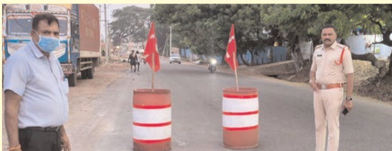
ప్రజా భూమి ప్రతినిధి-ఆగిరిపల్లి

-నెక్కలం-గొల్లగూడెం రహదారిపై ట్రాఫిక్ డ్రమ్ముల ఏర్పాటు