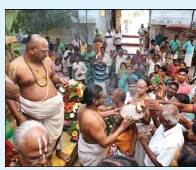
రాత్రి హంస వాహనం జూన్ 08 -- ఉదయం సింహ వాహనం, రాత్రి ముత్యపందిరి వాహనం జూన్ 09 -- ఉదయం కల్పవృక్ష వాహనం, సాయంత్రం కల్యాణోత్సవం, రాత్రి సర్వభూషాల వాహనం జూన్ 10 -- ఉదయం మోహినీ అవతారం, రాత్రి గరుడ వాహనం జూన్ 11 -- ఉదయం హనుమంత వాహనం, రాత్రి గజ వాహనం జూన్ 12 -- ఉదయం సూర్యప్రభ వాహనం, రాత్రి చంద్రప్రభ వాహనం జూన్ 13 -- ఉదయం రథోత్సవం, రాత్రి అశ్వవాహనం