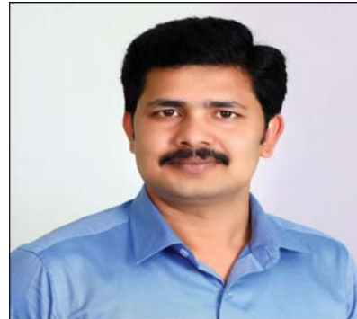
ప్రజలు నాయుడుపేట పట్టణానికి చేరుకునేందుకు వినియోగిస్తున్నట్లు గుర్తించామని, జాతీయ రహదారి నిర్మాణం కారణంగా ఆ అనుసంధానం దెబ్బతిన్న విషయాన్ని కూడా అంగీకరించారు. సమస్య పరిష్కారానికి అవని అపార్ట్ మెంట్

ప్రాంతంలోని కిలోమీటర్ 54.398 నుంచి ప్రారంభమై, కిలోమీటర్ 54.800 వద్ద ఉన్న బాక్స్ ట్రిప్లీ అనుసంధానమయ్యే విధంగా సుమారు 550 మీటర్ల పొడవుతో బండ్ల బాట నిర్మాణ పనులు ప్రారంభించినట్లు మంత్రి తెలిపారు. ఈ మార్గం పునరుద్ధరణ ద్వారా నాయుడుపేట పట్టణానికి ప్రజల రాకపోకలు సులభతరం కావడంతో పాటు, రహదారులపై ప్రమాదకరమైన ట్రాన్స్ మూవ్ మెంట్ తగ్గి రోడ్డు భద్రత మరింత పెరుగుతుందని పేర్కొన్నారు. ఈ సందర్భంగా ఎంపీ మద్దిల గురుమూర్తి మాట్లాడుతూ, సమస్యను కేంద్ర ప్రభుత్వం దృష్టికి తీసుకెళ్లిన వెంటనే సానుకూలంగా స్పందించి చర్యలు చేపట్టడం అనందాదాయకమన్నారు. ప్రజల అవసరాలకు అనుగుణంగా సమస్యల పరిష్కారం కోసం పార్లమెంట్ లోనూ, కేంద్ర మంత్రిత్వ శాఖల వద్ద నిరంతరం కృషి చేసినా సానుకూలంగా స్పందించినట్లు తెలిపారు.