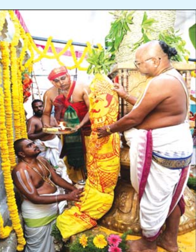
దేవతలను ఉత్సవాలకు అహస్వం విశ్వాసం భక్తుల్లో నెలకొని ఉంది. నేటి రాత్రి పెద్దశేష వాహనంపై దివ్య విహారం బ్రహ్మోత్సవాలలో భాగంగా ఈరోజు రాత్రి 7 గంటల నుండి 9 గంటల వరకు శ్రీ వేణుగోపాలస్వామివారు పెద్దశేష వాహనంపై భక్తులకు దర్శనమివ్వనున్నారు. బ్రహ్మోత్సవాల ప్రధాన ఘట్టాలు జూన్ 07 -- ఉదయం చిన్నశేష వాహనం, జూన్ 14 -- ఉదయం చక్రస్థానం, రాత్రి ధ్వజారోహణం జూన్ 09న శ్రీ స్వామివారి కల్యాణోత్సవం బ్రహ్మోత్సవాల్లో నాలుగో రోజైన జూన్ 09న శ్రీ వేణుగోపాలస్వామివారి కల్యాణ మహోత్సవం ఘనంగా నిర్వహించనున్నారు. రూ.750 చెల్లించి గృహస్థులు (ఇద్దరు) ఈ సేవలో పాల్గొనవచ్చు. పాల్గొనే భక్తులకు ఉత్తరీయం, రవీ, లడ్డూ, అప్పం ప్రసాదంగా అందజేయనున్నారు. జూన్ 15న పుష్పయోగం బ్రహ్మోత్సవాల అనంతరం జూన్ 15న మధ్యాహ్నం 1.30 గంటల నుండి 4 గంటల వరకు శ్రీ స్వామివారికి పుష్పయోగం భక్తిశ్రద్ధల మధ్య వైభవంగా నిర్వహించనున్నారు. ఈ కార్యక్రమంలో డిప్యూటీ ఈవో నాగరత్న ఆలయ ప్రధాన అధ్యక్షులు గోపాలాచార్యులు, కంకణ బిల్వర్ మురళీకృష్ణ స్వామి, సూపరింటెండెంట్ శ్రీనివాసులు రెడ్డి, టెంపుల్ ఇన్ స్పెక్టర్ ఎస్. చెంగల్ రాయలు, అధ్యక్షులు, శ్రీవారి సేవకులు, భక్తులు పాల్గొన్నారు.

ప్రజా భూమి ప్రతినిధి కార్యదినగరం కార్యదినగరంలోని శ్రీ రుక్మిణీ--సత్యభామ సమేత శ్రీ వేణుగోపాలస్వామివారి వార్షిక బ్రహ్మోత్సవాలు శనివారం ఉదయం ధ్వజారోహణ మహోత్సవంతో అత్యంత వైభవంగా ప్రారంభమయ్యాయి. ఉదయం 8.10 గంటల నుండి 8.45 గంటల మధ్య కర్పూరక లగ్నంలో వేదపండితుల మంత్రోచ్ఛారణలు, మంగళవాయిద్యాలు, భక్తుల గోవింద నామస్మరణలు సదుడు గరుడ చిత్రంతో అలంకరించిన ధ్వజపటాన్ని ధ్వజస్తంభంపై ప్రతిష్ఠించి ఉత్సవాలకు శ్రీకారం చుట్టారు. శాస్త్రోక్తంగా పూర్వార్థ క్రతువులు అంతకుముందు ఉదయం 4 గంటల నుండి ధ్వజప్రతిష్ఠ, రక్షాబంధనం, భోరితాదనం, నవనంది, బలిహారణం తదితర శాస్త్రోక్త క్రతువులు నిర్వహించారు. అనంతరం తిరుమాడ వీధుల్లో నిర్వహించిన ఉత్సవంలో రుక్మిణీ--సత్యభామ సమేత శ్రీ వేణుగోపాలస్వామి, చక్రత్యాగ్యార్, పరివార దేవతలు బంగారు తిరుచ్చి పుష్పాలకు దివ్య దర్శనం ఇచ్చారు. ముక్కోటి దేవతలకు అహస్వం నాలుగు మాడవీధుల్లో జరిగిన ఈ మహోత్సవం ఊరేగింపు ద్వారా స్వామివారు బ్రహ్మోత్సవాల పూర్తిని పర్యవేక్షించి, అష్టాదశ గణాలు, ముక్కోటి