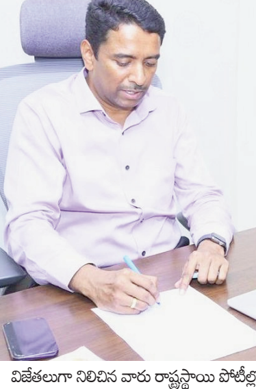
విజేతలుగా నిలిచిన వారు రాష్ట్రస్థాయి పోటీల్లో

ప్రజాభూమి ప్రతినిధి, విజయవాడ: సమాజంలోని ప్రతి వర్గానికి యోగా పట్ల అవగాహన కల్పించడం, ఆరోగ్యకరమైన జీవన శైలిని ప్రోత్సహించడం లక్ష్యంగా ప్రభుత్వం నిర్వహించే యోగాంధ్ర-2026లో భాగంగా ఈ నెల 7 నుంచి యోగా పోటీలు జరగనున్నట్లు జిల్లా కలెక్టర్ డా. జి.ఎ.కృష్ణ శనివారం ఓ ప్రకటనలో తెలిపారు. ఈ పోటీల్లో ప్రజలు పెద్దపత్తున పాల్గొని విజయవంతం చేయాలని కోరారు. ఈ నెల 7 నుంచి 9వ తేదీ వరకు గ్రామ/పార్కు స్థాయిలో యోగా ఫర్ ఆల్ - గ్రానోరూల్స్ వెల్సెన్ ఇతివృత్తంలో పోటీలు నిర్వహించనున్నట్లు తెలిపారు. జిల్లా పోటీలకు స్వర్ణ గ్రామం, స్వర్ణ వార్డు కార్యాలయాల్లో రిజిస్ట్రేషన్ చేసుకోవాలని సూచించారు. గ్రామస్థాయిలో విజేతలు మండల స్థాయికి, మండలస్థాయిలో విజేతలు జిల్లాస్థాయికి, అక్కడ