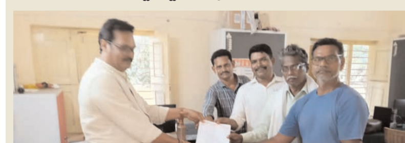
ప్రజా భూమి ప్రతినిధి-కూనవరం