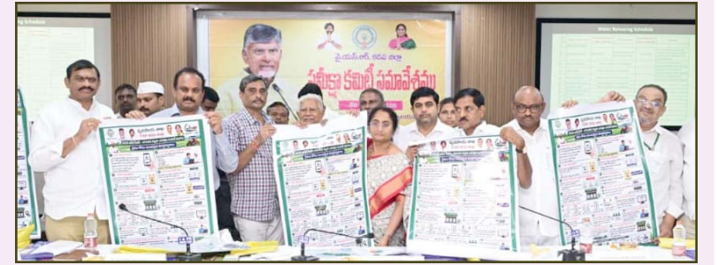
ప్రజాభూమి ప్రతినిధి, వై ఎస్ ఆర్ కడప: