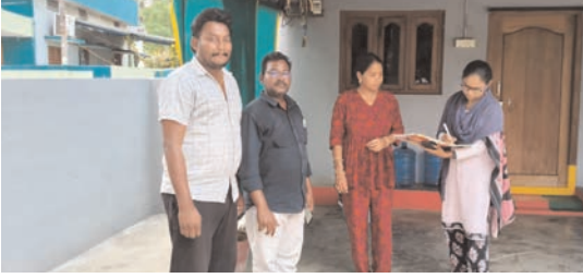
ప్రజాభూమి ప్రతినిధి - కూనవరం