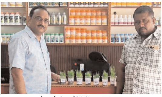
ప్రజాభూమి ప్రతినిధి - చాట్రాయి వరి సాగు చేసే రైతులు వరి విత్తనాలను కొనేటప్పుడు షాపు