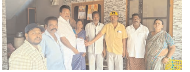
ప్రజాభూమి ప్రతినిధి - చాట్రాయి