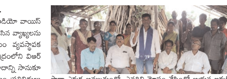
ప్రజాభూమి ప్రతినిధి - వి.ఆర్.పురం