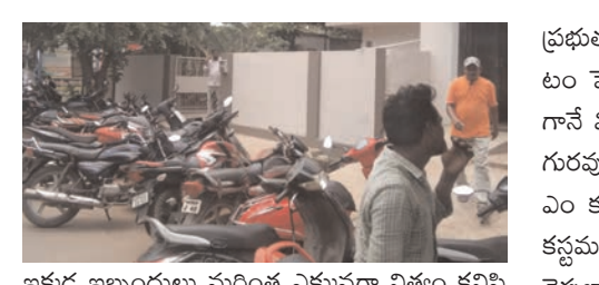
ప్రజాభూమి ప్రతినిధి - కాజులూరు

ప్రజాభూమి ప్రతినిధి - కాజులూరు కాజులూరు కరవ మండల పరిధిలో పలు గ్రామాలకు గొల్లపాలెంలో గల ప్రభుత్వ ప్రధాన బ్యాంక్ ఆయన స్టేట్ బ్యాంకు ప్రాంగణంలో పార్లొంగ్ స్థలం లేకపోవడంతో నిత్యం బ్యాంకుకు వచ్చే కస్టమర్లు తమ తమ వాహనాలను కోటిపల్లి -కాకినాడ ప్రధాన రహదారి వెంబడి ఎక్కడబడితే అక్కడ పెట్టడంతో నిత్యం ట్రాఫిక్ సమస్య నెలకొంది. దీంతో ఈ ప్రధాన రహదారిలో గొల్లపాలెం పోలీస్ స్టేషన్ నుండి పెట్రోల్ బంక్ వరకు వాహనాలను ప్రధాన రహదారి వెంబడి వదిలివేయడంతో పలుమార్లు ట్రాఫిక్ సంస్థ నెలకొని ప్రమాదాల సైతం చోటు చేసుకుంటున్నాయి. అలాగే ఈ బ్యాంకు పరిసర ప్రాంతాలతో పాటు పలుచోట్ల ప్రధాన రహదారికి ఇరువైపులా వాహనాలను ఇష్టానుసారంగా వదిలి పార్లొంగ్ చేయడంతో ట్రాఫిక్ సమస్య నిత్యం నెలకొంటుంది. అయితే ఇక్కడ స్టేట్ బ్యాంక్ ఆఫ్ ఇండియా బ్రాంచ్ ప్రధాన రహదారిని అనుకుని ఉండటం ఇక్కడ బ్యాంకుకు వచ్చే కస్టమర్ల వాహనాలకు ప్రత్యేక పార్లొంగ్ స్థలం లేకపోవడంతో వాహనదారులు చేసేది ఏమీ లేక ప్రధాన రహదారి వెంబడి పార్లొంగ్ చేయడం పరిపాలన అయిపోయింది. దీంతో