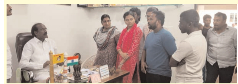
ప్రజా భూమి ప్రతినిధి-వీలూరు

ప్రజా సమస్యల పరిష్కారానికి రాష్ట్ర ప్రభుత్వం అత్యంత ప్రాధాన్యత ఇస్తోందని, తన దృష్టికి వచ్చిన ప్రతి సమస్యను అధికారుల దృష్టికి తీసుకెళ్లి పరిష్కరించేందుకు చర్యలు తీసుకుంటున్నట్లు వీలూరు ఎమ్మెల్యే బడేటి చందీ తెలిపారు. శనివారం వీలూరులోని ఎమ్మెల్యే క్యాంపు కార్యాలయంలో నిర్వహించిన ప్రజా వినతుల స్వీకరణ కార్యక్రమంలో ఆయన వివిధ ప్రాంతాల నుండి వచ్చిన ప్రజల సమస్యలను విన్నారు. ప్రతి వినతిని పరిశీలించి, సంబంధిత అధికారులకు తగిన ఆదేశాలు జారీ చేసిన ఎమ్మెల్యే, ప్రజల ఎలాంటి సమస్య ఉన్నా తన దృష్టికి తీసుకురావాలని సూచించారు. ప్రజా సంక్షేమమే లక్ష్యంగా ప్రభుత్వం పనిచేస్తోందని, అన్ని వర్గాల అభ్యుత్థికి సంక్షేమ పథకాలను సమర్థవంతంగా అమలు చేస్తున్నట్లు పేర్కొన్నారు. కార్యక్రమంలో తెలుగుదేశం పార్టీ నాయకులు, కార్యకర్తలు పాల్గొన్నారు.