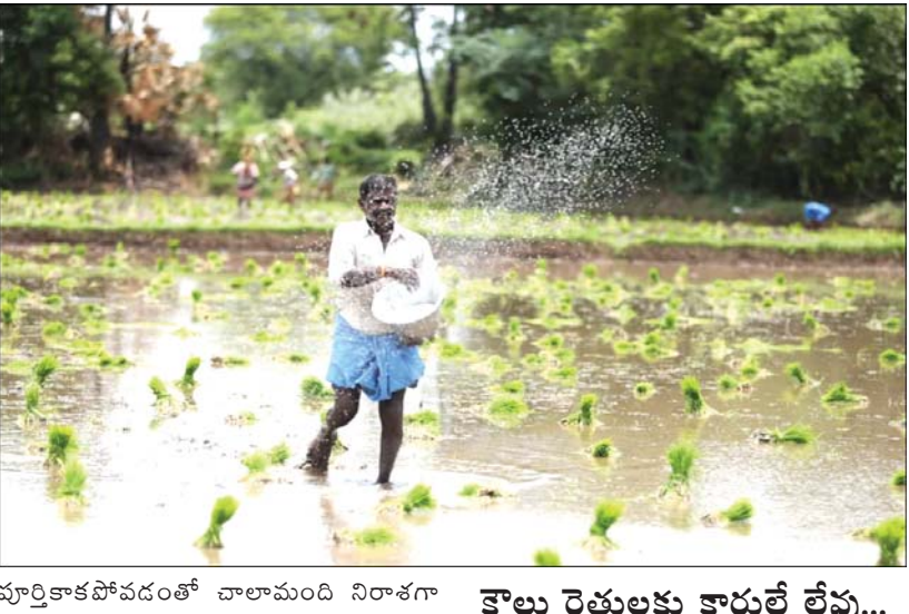
పూర్తికాకపోవడంతో చాలామంది నిరాశగా వెనుదిరుగుతున్నారు.

ప్రజాభూమి, హిందూపురం టౌన్ వానలు కురిసి ఖరీఫ్ సాగు జోరందుకుంటున్న వేళ ఉమ్మడి అనంతపురం జిల్లా రైతాంగం మరోసారి ఎరువుల కష్టాల్లో చిక్కుకుంది. పొలంలో విత్తనం వేయడానికి సిద్ధమైన రైతు ఇప్పుడు ఎరువు బస్తా కోసం దుకాణాల చుట్టూ తిరగాల్సిన పరిస్థితి ఏర్పడింది. చేతిలో డబ్బు ఉన్నా ఎరువు దొరకని దుస్థితి నెలకొంది. యాప్ అనుమతిస్తేనే బస్తా.. లేదంటే నిరాశతో వెనుదిరగాల్సిందే. ఒకప్పుడు అవసరమైనన్ని బస్తాలు కొనుగోలు చేసిన రైతులు ఇప్పుడు యాప్ కేటాయించిన ఒకటి, రెండు బస్తాల కోసం గంటల తరబడి క్యూల్లో నిలబడుతున్నారు. యాప్ దే రాజ్యం... రైతు అవసరాలకు విలువ లేదా...! ప్రస్తుతం రాష్ట్ర ప్రభుత్వం అమలు చేస్తున్న ఎరువుల పంపిణీ విధానంలో యాప్ దే తుది నిర్ణయం. రైతు ఆధారం నంబర్ సమూహ చేసిన పోటన్ వెబ్సైట్లో వివరాలు, యూరియా, గత ఖరీఫ్ సాగు చేసిన పంటలు, భూమి విస్తీర్ణం వంటి సమాచారం తెరపై కనిపిస్తుంది. వాటి ఆధారంగానే రైతుకు ఎంత ఎరువు ఇవ్వాలో యాప్ నిర్ణయిస్తోంది. రైతు ప్రస్తుతం ఏ పంట సాగు చేస్తున్నాడన్నది వక్కపెట్టి గత ఏడాది సమూహాల పంటల ఆధారంగా కోటా కేటాయిస్తుందంటే అనేక మంది రైతులు తీవ్ర ఇబ్బందులు ఎదుర్కొంటున్నారు. ఒకేసారి మొత్తం కోటా ఇవ్వకుండా రెండు, మూడు విడతలుగా విభజించి చూపుతుండటంతో రైతులకు అవసరమైన సమయంలో అవసరమైన ఎరువులు అందడం లేదు.