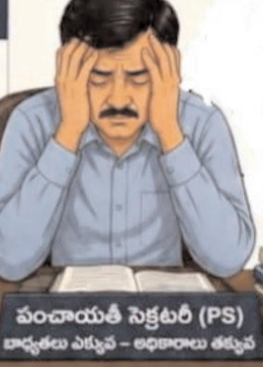
పంచాయతీ సెక్టరీ (PS) కార్యకర్తల ఎక్సలెన్స్ - అధికారులు తప్ప

పాత పద్ధతిలోనే చెల్లింపులు జరగాలి గతంలో ప్రత్యేక అధికారి హోదాలో చెక్కులు మార్చడానికి వీలు ఉండేది. ఇప్పుడు చేసిన పనులకు, కొందరు జీతాలు తీసుకోవడానికి డిఎల్ పి ఓ, డి పి ఓ అప్రూవల్ కావాలని ఉండడంతో గ్రామాల్లో అభివృద్ధి పనులకు అటంకం కలుగుతుందని పలువురు అంటున్నారు. కొంతమంది సిబ్బంది జీతాలు కూడా ఆరు నెలలకు పైబడి ఇవ్వకపోవడంతో సిబ్బంది గ్రామాల్లో అభివృద్ధి పనులు చేయడానికి రావడం లేదని మరికొందరు అంటున్నారు. కావున గతంలో మాదిరిగా పాత పద్ధతిలోనే గ్రామాల్లో అభివృద్ధి పనులకు, సిబ్బంది జీతాలు చెల్లించడానికి చర్యలు తీసుకోవాలని ప్రభుత్వాన్ని కోరుతున్నారు.