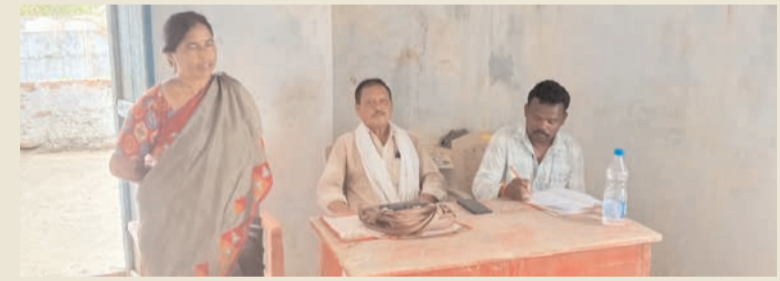
ప్రజా భూమి ప్రతినది-కూనవరం