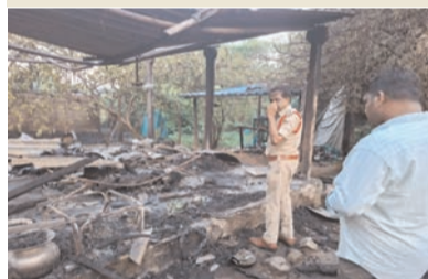
ప్రజా భూమి ప్రతినిధి-వేలేరుపాడు