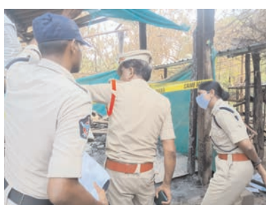
అభ్యర్థన మేరకు అన్ని రకాల దర్యాప్తులను కొనసాగిస్తామని ఇందుకుగాను విజయవాడ

వేలేరుపాడు మండలంలో సోమవారం ఆర్డర్ల ఇద్దరు మహిళల సజీవ దహనం విషయంలో అన్ని కోణాల్లో దర్యాప్తు చేసే నిజానిజాలు వెల్లడిస్తామని ఏఎస్పి సుస్మిత పేర్కొన్నారు. జరిగిన సంఘటనను అధికారుల ద్వారా సమాచారం అందుకున్న ఏ.ఎస్.పి చూడటానికి విలేరుపాడులోని సంఘటన స్థలానికి చేరుకొని పరిశీలించారు. అనంతరం మృతుల కుటుంబీకులతో మాట్లాడి వారి