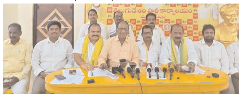
ప్రజాభూమి ప్రతినిధి - మచిలీపట్నం