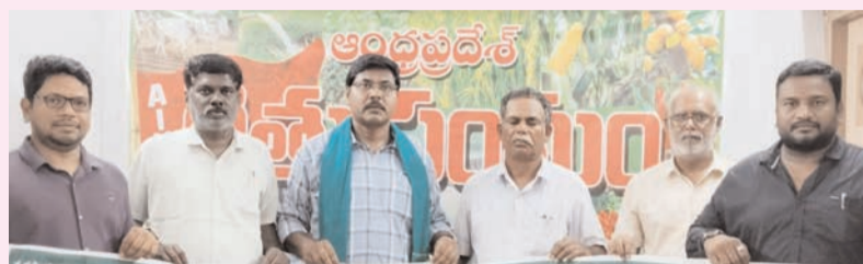
ప్రజా భూమి ప్రతినిధి-ఏలూరు