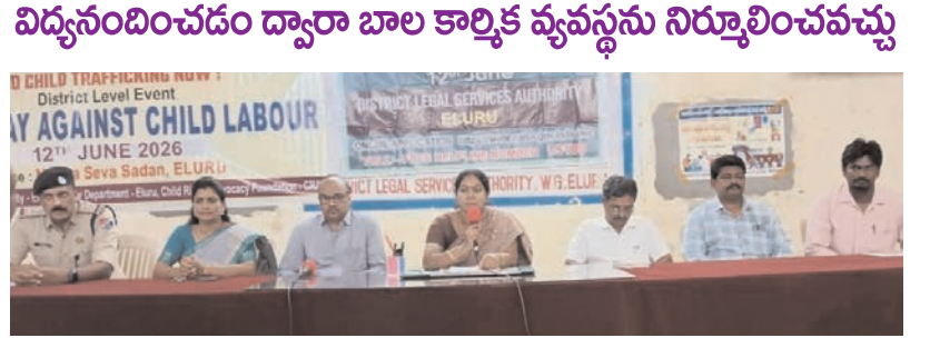
ప్రజాభూమి ప్రతినిధి - ఏలూరు జిల్లా