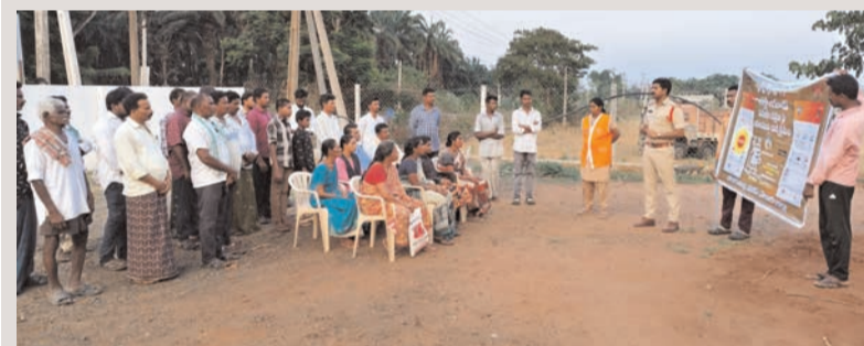
ప్రజా భూమి ప్రతినిధి-జీలుగుమిల్లి

మహిళల భద్రత, బాల రక్షణ చట్టాలపై సూచనలు ఎన్ఐ క్రాంతి కుమార్