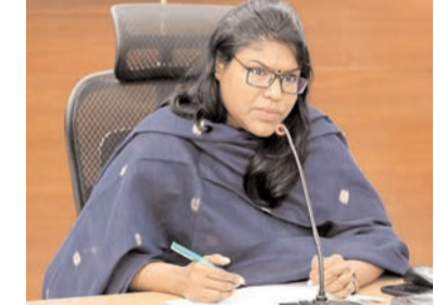
1,635 మంది గర్భిణులను గుర్తించగా, వారిలో 790 మందిని హైరిస్క్ గర్భిణులుగా గుర్తించినట్లు వెల్లడించారు. జూన్, జూలై, ఆగస్టు మూడు నెలల్లో ప్రసవాలకు సిద్ధంగా ఉన్న 624 మంది గర్భిణుల్లో 315 మంది హైరిస్క్ గర్భిణులుగా గుర్తించ బడ్డారు. వీరందరికీ సురక్షిత ప్రసవాల జరగేలా అన్ని చర్యలు చేపట్టాలని అధికారులను ఆదేశించారు. ప్రాజెక్టు అమలులో సాధించవలసిన పురోగతి, ఎదురవుతున్న సమస్యలు, వాటిపరిష్కారానికి తీసుకోవాల్సిన చర్యలుపై అధికారులతో చర్చించారు. జిల్లాలో తల్లి, శిశు

ప్రజా భూమి ప్రతినిధి-ఏలూరు జిల్లా ఏలూరు జిల్లాలో తల్లి, శిశు మరణాలను పూర్తిగా నివారించాలనే లక్ష్యంతో అమలు చేస్తున్న "ప్రాజెక్టు మాతృ- జిల్లా" జిల్లా, ఎంఎంఆర్, పైలట్ ప్రాజెక్టు" అమలుపై జిల్లా కలెక్టరులు గౌతమీ సమావేశ మందిరంలో మంగళవారం వైద్య, ఆరోగ్యశాఖ అధికారులు, వైద్యాధికారులు లతో జిల్లా కలెక్టరు కె.వెల్లెసెల్వీ అధ్యక్షతన సమీక్షను సమావేశం నిర్వహించారు. ఈ సందర్భంగా జిల్లా కలెక్టరు కె.వెల్లెసెల్వీ మాట్లాడుతూ గర్భిణులు, బాలింతలకు నాణ్యమైన వైద్యసేవలు అందించడంతో పాటు శిశువులు ఆరోగ్య పరిరక్షణకు ప్రత్యేక చర్యలు చేపట్టాలని అధికారులను ఆదేశించారు. తల్లి, శిశు మరణాలను పూర్తిగా నివారించేందుకు వైద్య, ఆరోగ్యశాఖ అధికారులు, వైద్యాధికారులు, సిబ్బంది క్షేత్రస్థాయిలో సమన్వయంతో పని చేయాలని సూచించారు. అధిక ప్రమాద (హైరిస్క్) గర్భిణులను గుర్తించి నిరంతరం పర్యవేక్షణ చేయడం, ప్రసవాలకు ముందు మరియు తరువాత అవసరమైన వైద్యసేవలు అందించడం, సంస్థాగత ప్రసవాలను ప్రోత్సహించడం, గ్రామస్థాయిలో అవగాహన కార్యక్రమాల నిర్వహించడం వంటి అంశాలపై జిల్లా కలెక్టరు అధికారులకు దిశానిర్దేశం చేశారు. హైరిస్క్ గర్భిణులను ప్రసవానికి ముందు ఒక నెలపాటు రోజువారీగా ఆరోగ్యపరంగా పర్యవేక్షించాలని, ప్రతి హైరిస్క్ గర్భిణిపైలను పర్యవేక్షణ కోసం ఒక ఆడాప్టర్ అధికారిని నియమించాలని జిల్లా కలెక్టరు ఆదేశించారు. రాష్ట్ర ముఖ్యమంత్రి అదేశాలు మేరకు జిల్లాలో వినూత్న కార్యక్రమంగా నూజివీడు క్లస్టర్ పరిధిలో ఈ ప్రాజెక్టును పైలట్ ప్రాజెక్టుగా అమలు చేస్తున్నామని అన్నారు. నూజివీడు క్లస్టర్ పరిధిలో 11 ప్రాథమిక ఆరోగ్యకేంద్రాలు, అల్పన హెల్త్ సెంటర్ పరిధిలో మొత్తం