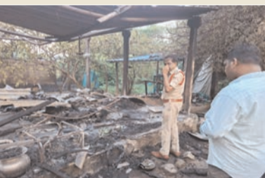
ప్రజా భూమి ప్రతినిధి-వేలేరుపాడు