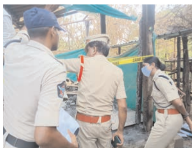
అభ్యర్థన మేరకు అన్ని రకాల దర్యాప్తులను కొనసాగిస్తామని ఇందుకుగాను విజయవాడ