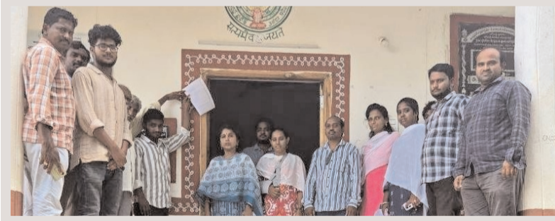
ప్రజా భూమి ప్రతినిధి-ఆగిరిపల్లి

-ఖరీఫ్ సీజన్ కు కొత్త విధానంపై సిబ్బందికి శిక్షణ