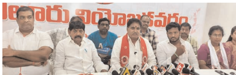
కళ్యాణ్ ను లక్ష్యంగా చేసుకుని తప్పుడు ప్రచారం చేస్తున్నారని ఆయన ఆరోపించారు.