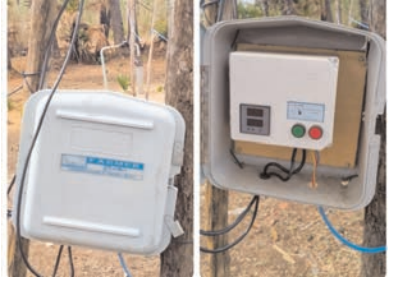
ప్రజాభూమి ప్రతినిధి - వి.ఆర్.పురం.

గుర్రంపేట గ్రామంలో నీటి మోటారు చెడిపోయి నీటి కొరత ఉన్నా అధికారులు స్పందించకపోవడం చాలా బాధాకరం అని, తాగునీటికి తీవ్ర ఇబ్బందులు పడుతున్నామని, మాత్రాగనీటి సమస్యను పరిష్కరించాలని గుర్రంపేట గ్రామస్థులు కోరుతున్నారు. దాదాపుగా రెండు వారల నుంచి త్రాగునీటి మోటారు పనిచేయడం లేదని, అంతకు ముందు ఇదే విధంగా పని చేయకపోతే బాగుచేసారని, కానీ కొద్ది రోజులకే అది మళ్ళీ పడిందని, ఎప్పుడు కూడా నాసిరకం పరిస్థితులతో అమర్చడం వలన మోటారు కొద్ది రోజులు మాత్రమే నీటిని సరఫరా చేస్తుందని వారు తెలిపారు. అసలే ఎండాకాలం నీటి కొరత వలన గ్రామ ప్రజలు చాలా అవస్థలు పడుతున్నారు, కావున గ్రామ పంచాయతీ అధికారులు ఈ సమస్యపై వెంటనే స్పందించి నీటి కొరత సమస్యను పరిష్కారం చేయించగలరని గ్రామస్థులు కోరుతున్నారు.