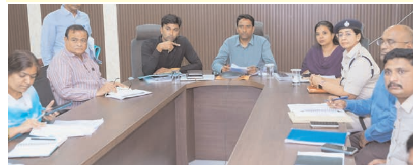
ప్రజాభూమి ప్రతినిధి, - విజయవాడ