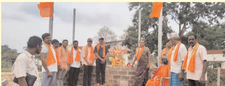
ప్రజా భూమి ప్రతినిధి-జీలుగుమిల్లి

జీలుగుమిల్లి ప్రధాన కూడలిలో వెలసిన శ్రీశ్రీ బాల జగదాంబ అమ్మవారికి శనివారం భక్తులు ఘనంగా పూజలు నిర్వహించారు. గ్రామదేవత శ్రీ జగదాంబ అమ్మవారి ఆలయం ఎదురుగా నాలుగు రోడ్ల కూడలిలో అమ్మవారి వెలయడం గ్రామానికి శుభపరిణామమని గ్రామస్థులు హర్షం వ్యక్తం చేశారు. ఉదయం నుంచే మహిళలు, భక్తులు పెద్ద సంఖ్యలో అమ్మవారి దర్శించుకుని ప్రత్యేక పూజలు చేశారు. గ్రామం సుభిక్షంగా ఉండాలని, పాడివంటలు సమృద్ధిగా పండాలని, ప్రజలు సుఖానందంతో జీవించాలని అమ్మవారిని ప్రార్థించారు. భక్తిశ్రద్ధలతో నిర్వహించిన ఈ కార్యక్రమంలో హిందూ సంఘాల ప్రతినిధులు, గ్రామ పెద్దలు, మహిళలు పాల్గొన్నారు. ఆలయ నిర్వాహానికి ప్రతి ఒక్కరూ సహకరించాలని భక్తులు కోరారు.