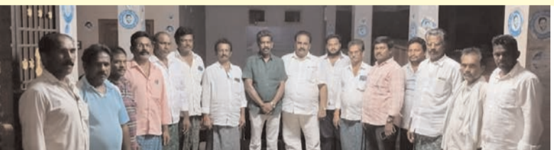
ప్రజా భూమి ప్రతినిధి-కామవరపుకోట