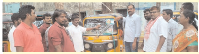
ప్రజా భూమి ప్రతినిధి-కుకునూరు