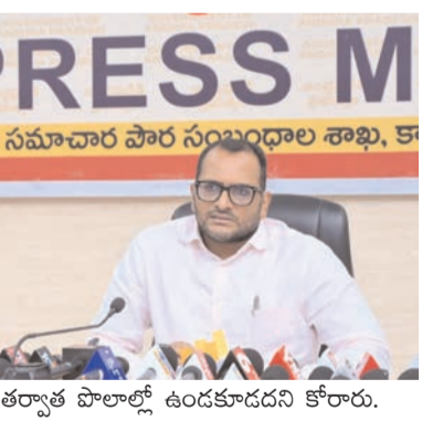
సమాచార పార సంబంధాల శాఖ, కాకినాడ