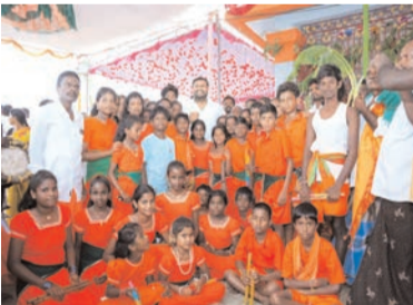
నిల్లాలని ప్రార్థించాను.అనంతరం నా సొంత గ్రామ ప్రజలతో, పెద్దలతో కలిసి కాసేపు

నా సొంత గ్రామమైన ఊరందూరు హరిజన వాడ నందు అత్యంత భక్తిశ్రద్ధలతో జరిగిన శ్రీ శ్రీ శ్రీ పాండురంగ స్వామి వారి అగ్నిగుండ మహోత్సవంలో గ్రామస్థులు అత్యుత్సాహం మేరకు పాల్గొన్నారు.లిమిదుంధూ స్వామివారి ని దర్శించుకుని, ప్రత్యేక పూజలు నిర్వహించి, నియోజకవర్గ ప్రజలందరిపై ఆ భగవంతుని కృపాకటాక్షాలు ఎల్లప్పుడూ ఉండాలని, ప్రతి ఇల్లా ఆయురారోగ్యాలు, ఆప్టైమ్మెంట్ వల