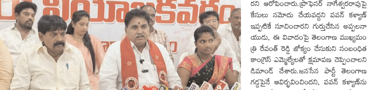
స్థానిక పేర్కొన్న ఆయన, ప్రాంతాల మధ్య చిచ్చు పెట్టే ప్రయత్నాలను ప్రతి ఒక్కరూ ఖండించాలని పిలుపునిచ్చారు. తెలంగాణలో జనసేనకు పెరుగుతున్న ఆదరణను చూసి లను, తెలంగాణ ఉద్యమ స్ఫూర్తిని గౌరవి