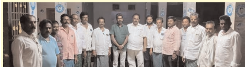
ప్రజా భూమి ప్రతినిధి-కామవరపుకోట

జూన్ 4న వెన్నుపోటుకు రెండేళ్ల సందర్భంగా నిరసన కార్యక్రమం -వైస్సాల్సీమి అధ్యక్షులు వైస్ జగన్ మోహన్ రెడ్డి విలుపు.