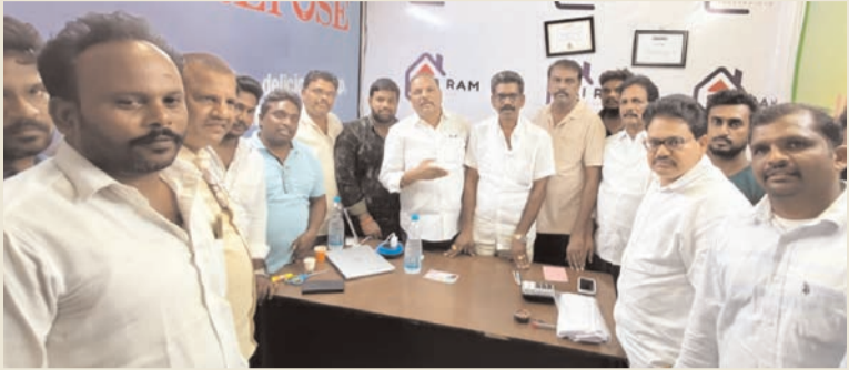
ప్రజా భూమి ప్రతినిధి, కామవరపుకోట