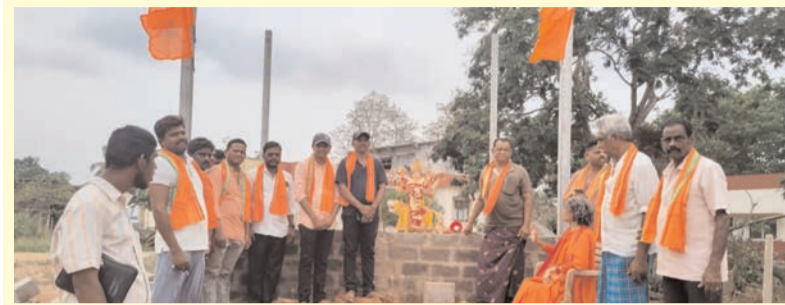
ప్రజా భూమి ప్రతినిధి-జీలుగుమిల్లి

జీలుగుమిల్లిలో బాల జగదాంబ అమ్మవారికి ఘన పూజలు