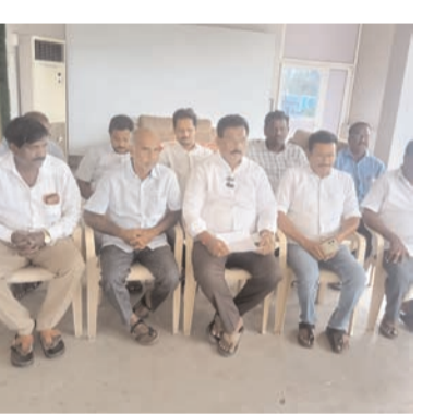
సంఘం తరఫున పేదలకు రొయ్యలు, గోంగూర మరియు చేపల పులుసుతో భోజనాలు ఏర్పాటు చేసినట్లు తెలిపారు. అదే విధంగా సరసాపురం నియోజకవర్గంలో ఎమ్మెల్యే బొమ్మిడి నాయకర్ సారధ్యంలో సర్పాపురం సెంటర్లో సంఘం తరఫున పేదలకు రొయ్యలు, గోంగూర, చేపల పులుసుతో భోజనాలు ఏర్పాటు చేసినట్లు తెలిపారు. అదేవిధంగా పాలకొల్లు, నరసాపురం, ఆవంట నియోజకవర్గాల్లో గ్రామాలు, పట్టణ వార్డుల్లో

పెంచడం, నాణ్యమైన సీడ్ ఇవ్వకపోవడం వంటి సమస్యలను అధిగమించేటందుకు సూతన మార్గాలను ఎంచుకున్నట్లు తెలిపారు. దీనిలో భాగంగానే మృగశిర కారై ప్రాంతంలో జన అనగా జూన్ 8వ తేదీ సోమవారం రోజున ప్రోటీన్లతో కూడిన ఆరోగ్యం కోసం ఆలోచించాల్సిన రొయ్యలు ప్రతి కుటుంబం ఒక కిలో రొయ్యలు మరియు ఒక కిలో చేపలను కొనుగోలు చేసుకుని వినియోగించేలా ప్రజల్లో చైతన్యం సంఘం తరఫున కలిగించాలని, ఆ దిశగా చర్యలు తీసుకుంటున్నట్లు తెలిపారు. అదేవిధంగా అదే రోజున అనగా జూన్ 8వ తేదీన ఉదయం 10 గంటలకు పాలకొల్లు నియోజకవర్గంలో మంత్రి నిమ్మల రామానాయుడు సారధ్యంలో గాంధీ బొమ్మ సెంటర్లో సంఘం తరఫున పేదలకు రొయ్యలు, గోంగూర కూర, మరియు చేపల పులుసుతో ఉచిత భోజనాలు ఏర్పాటు చేసినట్లు తెలిపారు. అదేవిధంగా ఆవంట నియోజకవర్గంలో ఎమ్మెల్యే పితాని సత్యనారాయణ సారధ్యంలో మార్కెట్లో