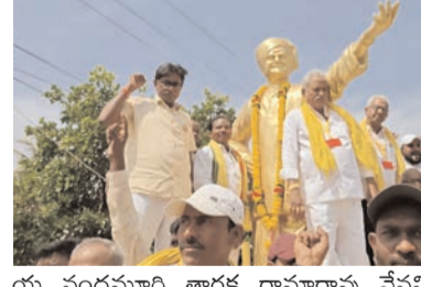
య నందమూరి తారక రామారావు వేసిన కొనియాడారు. పేదల అభ్యున్నతికి పలు పథకాలను ప్రవేశపెట్టిన ఘనత ఆయనకే దక్కిందన్నారు. మారుమూల ప్రాంతాలకు నిలువని ఘనత ఎన్టీఆర్ దేసిన, ఈ విధంగా ఆయన చేసిన ప్రజా ఆమోద కార్యక్రమాలను గుర్తు చేసుకున్నారు. అనంతరం పార్టీ కార్యాలయం వద్ద వర్చువల్ మహానాడు కార్యక్రమానికి ఎన్టీఆర్ జయంతి వేడుకలకు సంయుక్తంగా పాల్గొన్న పార్టీ శ్రేణులు అందరికీ భోజన పనెటిని కల్పించారు. ఈ కార్యక్ర