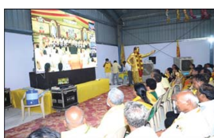
ప్రజా భూమి ప్రతినిధి, చంద్రగిరి: చంద్రగిరి నియోజకవర్గం పాకాల మండలంలోని దామచెరువు, చెన్నూరిపల్లిలో ఉన్న ప్రవేల్ చాలో జరుగుతున్న మహానాడు కార్యక్రమానికి చంద్రగిరి ఎమ్మెల్యే పులివర్తి నాని ముఖ్య అతిథిగా గురువారం విచ్చేశారు.

ప్రజా భూమి ప్రతినిధి, చంద్రగిరి: చంద్రగిరి నియోజకవర్గం పాకాల మండలంలోని దామచెరువు, చెన్నూరిపల్లిలో ఉన్న ప్రవేల్ చాలో జరుగుతున్న మహానాడు కార్యక్రమానికి చంద్రగిరి ఎమ్మెల్యే పులివర్తి నాని ముఖ్య అతిథిగా గురువారం విచ్చేశారు. చంద్రగిరి ఎమ్మెల్యే పులివర్తి నాని శ్యామలతో సత్కరించి, పుష్పగుచ్ఛం ఇచ్చి స్వాగతం పలికారు. తెలు