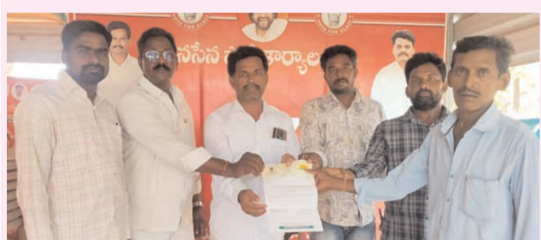
ప్రజా భూమి ప్రతినిధి-వేలేరుపాడు