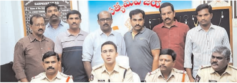
ప్రజాభూమి ప్రతినిధి - కాకినాడ రూరల్