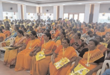
లు పనుపు చొక్కాలు లో నాయకులు, కార్యకర్తలు ధరించి రావడంతో ప్రాంగణమంతా పనుపు మయంగా మారింది.