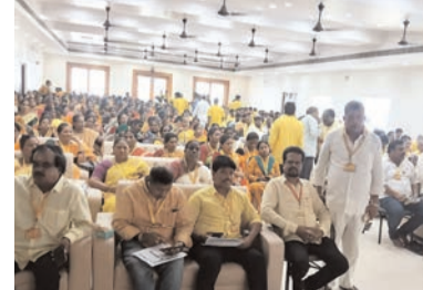
ముగింపు ఉత్సవం రోజున .పార్టీ శ్రేణులు పెద్ద ఎత్తున తరలివచ్చారు. అధిక సంఖ్యలో మహిళానాయకురాలు పనుపు చీరలు, పురుషులు పనుపు చొక్కాలు లో నాయకులు, కార్యకర్తలు ధరించి రావడంతో ప్రాంగణమంతా పనుపు మయంగా మారింది.

ప్రజా భూమి ప్రతినిధి-ఆగిరిపల్లి ఆగిరిపల్లి మండల వ్యాప్తంగా ముస్లిం సోదరులు బక్రీడ్ పండుగను భక్తి శ్రద్ధలతో జరుపుకున్నారు. ఉదయం ఉదాత వర్ష ప్రత్యేక ప్రార్థనలు నిర్వహించి, మత పెద్దల సందేశాలను ఆలకించారు. అనంతరం తమ పూర్వీకుల సమాధుల వద్ద ప్రార్థనలు చేసి, సంప్రదాయం ప్రకారం కుర్బానీ నిర్వహించారు. త్యాగానికి ప్రతీకగా భావించే ఈ పండుగ సందర్భంగా పేదలకు, బంధువులకు మాంసాన్ని పంచిపెట్టి సోదరభావాన్ని చాటుకున్నారు. ఒకరినొకరు ఆగిరిగనం చేసుకుంటూ బక్రీడ్ శుభాకంక్షలు తెలియజేసుకున్నారు.