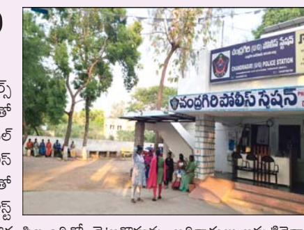
ప్రజా భూమి ప్రతినిధి చంద్రగిరి నియోజకవర్గ హెడ్ క్వార్టర్స్ చంద్రగిరి పోలీస్ స్టేషన్లో సిబ్బంది కొరతతో సమస్యలు తలచుకున్న బాధితులు. రెండు నేషనల్ హైవేలు, పలు విద్యాసంస్థలు మండల పోలీస్ స్టేషన్ పరిధిలో ఉన్నాయి.

ప్రజా భూమి ప్రతినిధి చంద్రగిరి నియోజకవర్గ హెడ్ క్వార్టర్స్ చంద్రగిరి పోలీస్ స్టేషన్లో సిబ్బంది కొరతతో సమస్యలు తలచుకున్న బాధితులు. రెండు నేషనల్ హైవేలు, పలు విద్యాసంస్థలు మండల పోలీస్ స్టేషన్ పరిధిలో ఉన్నాయి. సిబ్బంది కొరతతో ఇప్పటికే విద్యార్థులకు పక్కా ఉన్న అప్లైడ్ పోస్ట్ వర్గ పోలీసులు లేని పరిస్థితి ఉన్నారని, డాక్టర్ దంపతులను అభినందించినా అధికారులు స్పందించి సిబ్బందిని నియమించాలని కోరుతున్న స్థానికులు.