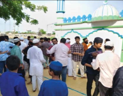
ప్రజా భూమి ప్రతినిధులు రేణిగుంట. రేణిగుంట మస్జిద్-ఎ-మదీనాలో శాంతియుతంగా ఈ డి నమాజ్ ఆగ్మానికి ప్రతిరూపం భావించే బక్రీద్ (ఈడ్-ఉల్-అజ్జా) పండగను రేణిగుంట పట్టణంలోని మస్జిద్-ఎ-మదీనాలో ముస్లిం సోదరులు భక్తిశ్రద్ధలతో భుజించారు జరుపుకున్నారు. గురువారం ఉదయం ప్రత్యేక ఈడ్ నమాజ్ ను శాంతియుత వాతావరణంలో నిర్వహించారు. ఈ సందర్భంగా గె పెద్ద సంఖ్యలో ముస్లింలు మస్జిద్ కు చేరుకుని ప్రత్యేక ప్రార్థనలు చేశారు.

ప్రజా భూమి ప్రతినిధులు రేణిగుంట. రేణిగుంట మస్జిద్-ఎ-మదీనాలో శాంతియుతంగా ఈ డి నమాజ్ ఆగ్మానికి ప్రతిరూపం భావించే బక్రీద్ (ఈడ్-ఉల్-అజ్జా) పండగను రేణిగుంట పట్టణంలోని మస్జిద్-ఎ-మదీనాలో ముస్లిం సోదరులు భక్తిశ్రద్ధలతో భుజించారు జరుపుకున్నారు. గురువారం ఉదయం ప్రత్యేక ఈడ్ నమాజ్ ను శాంతియుత వాతావరణంలో నిర్వహించారు. ఈ సందర్భంగా గె పెద్ద సంఖ్యలో ముస్లింలు మస్జిద్ కు చేరుకుని ప్రత్యేక ప్రార్థనలు చేశారు. దేశంలో శాంతి, సౌభ్రాతృత్వం నెలకొనాలని, ప్రజలు సుఖంతో తోపాటు ఉండాలని ఆల్లాహ్ ను ప్రార్థించారు. మత పెద్దలు బక్రీద్ పండగ ప్రాముఖ్యతను వివరిస్తూ ఆగ్మాం, సేవాభావం, సోదరభావం మనస్థిర జీవితంలో ఎంతో ముఖ్యమని తెలిపారు. నమాజ్ అనంతరం ఒకరినొకరు అలింగనం చేసుకుని బక్రీద్ శుభాకాంక్షలు తెలియజేసుకున్నారు.