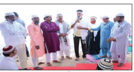
ప్రజా భూమి ప్రతినిధి, చంద్రగిరి: ఆగ్మాం, విశ్వాసం ప్రతీక ఈ బక్రీద్ ... చంద్రగిరి నియోజకవర్గ ముస్లిం సోదర సోదరీ మణులకు బక్రీద్ ను శుభాకాంక్షలు తెలిపిన ఎమ్మెల్యే పులివర్తి నాని. చంద్రగిరిలో గురువారం ఉదయం ప్రత్యేక ఈడ్ నమాజ్ ను శాంతియుత వాతావరణంలో నిర్వహించారు. ముస్లిం మత పెద్దలు, సోదరులతో కలిసి ప్రత్యేక ప్రార్థనలు చేశారు. మత పెద్దలు బక్రీద్ పండగ ప్రాముఖ్యతను వివరిస్తూ ఆగ్మాం, సేవాభావం, సోదర భావం, మనస్థిర జీవితంలో ఎంతో ముఖ్యమని తెలిపారు. నమాజ్ అనంతరం ఒకరినొకరు అలింగనం చేసుకొని బక్రీద్ శుభాకాంక్షలు తెలుపుకున్నారు. ఈ సందర్భంగా ఎమ్మెల్యే పులివర్తి నాని సోదరులకు అర్జునైన కాలాగా ఇంకా సహాయపడుతా అన్నారు. ఈ సందర్భంగా ముస్లిం పెద్దలు మాట్లాడుతూ మనసుకు, షాది మహల్ మరీయు లోడ్డు నిర్మాణంలో సూ ఎమ్మెల్యే చేసిన సహాయ సహకారాలు మరువలేము, మేము ఎప్పుడూ మీకు రుణపడి ఉంటాము అని చంద్రగిరి ముస్లిం సోదరులు తెలిపారు. ఈ కార్యక్రమంలో కూటమి నాయకులు కార్యకర్తలు ముస్లిం సోదరులు పాల్గొన్నారు.

ప్రజా భూమి ప్రతినిధి, చంద్రగిరి: ఆగ్మాం, విశ్వాసం ప్రతీక ఈ బక్రీద్ ... చంద్రగిరి నియోజకవర్గ ముస్లిం సోదర సోదరీ మణులకు బక్రీద్ ను శుభాకాంక్షలు తెలిపిన ఎమ్మెల్యే పులివర్తి నాని. చంద్రగిరిలో గురువారం ఉదయం ప్రత్యేక ఈడ్ నమాజ్ ను శాంతియుత