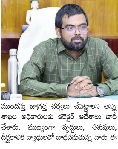
మొందను జాగ్రత్త చర్యలు చేపట్టాలని అన్ని శాఖల అధికారులకు కలెక్టర్ ఆదేశాలు జారీ చేశారు. ముఖ్యంగా వృద్ధులు, శిశువులు, దీర్ఘకాలిక వ్యాధులతో బాధపడుతున్న వారు ఈ

కలెక్టర్ డి.కె. బాలాజీ అత్యవసర ఆదేశాలు.. ఉదయం 11 నుంచి మధ్యాహ్నం 3 గంటల వరకు బయటకు రావద్దు మచిలీపట్నం/ప్రజాభివృద్ధి ప్రతినిధి కృష్ణాజిల్లా ప్రజలకు రోజురోజుకూ అత్యంత కీలకం కానున్నాయి. జిల్లాలో మే 20 నుంచి మే 24 వరకు ఉష్ణోగ్రతలు భారీగా పెరిగి అవకాశం ఉందని, తీవ్రమైన పదార్థాలు (హీట్ వేవ్) వీచే ప్రమాదం ఉందని జిల్లా కలెక్టర్ డి.కె. బాలాజీ హెచ్చరించారు. రాష్ట్ర విపత్తు నిర్వహణ సంస్థ (APSDMA), భారత వాతావరణ శాఖ (IMD) జారీ చేసిన ప్రత్యేక వార్తలను భారీగా పెరిగి జిల్లా యంత్రాంగాన్ని ఆయన అప్రమత్తం చేశారు. పరిస్థితిని నిరంతరం పర్యవేక్షిస్తూ