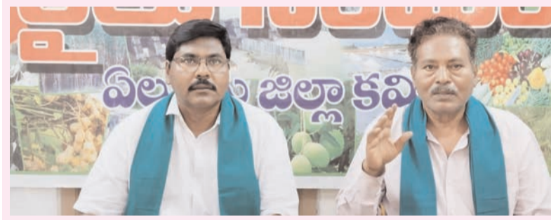
ప్రజా భూమి ప్రతినిధి-ఏలూరు