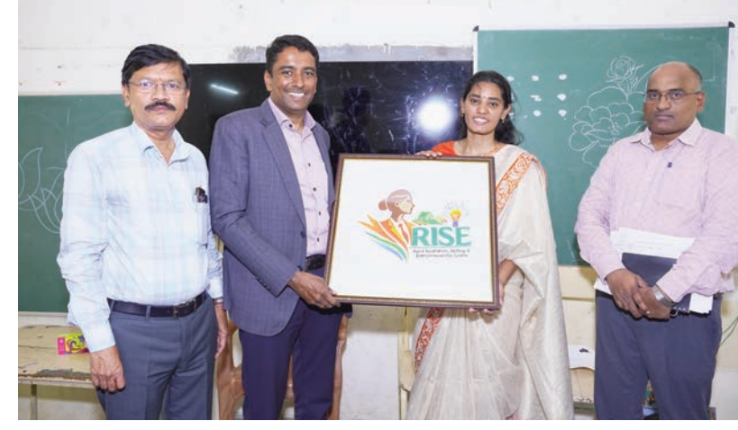
తన సమర్థవంతంగా అమలు చేయాలని నబంధింపే అధికారులకు కలెక్టర్ లక్ష్యాలు సూచించారు. కార్యక్రమంలో డి.ఆర్.డి.పీ. డి.ఎస్.ఎస్. నాచురల్ పాల్గొన్నారు.

స్వయం సహాయక సంఘాలను సైపు బ్యాప్టిమియర్ ద్వారా మహిళలకు స్వయం ఉపాధి అవకాశాలను పెంపొందించుకోవచ్చని, కుటుంబ ఆర్థిక స్థితిని మెరుగుపరచడంలో ఇటువంటి శిక్షణలు కీలక పాత్ర పోషిస్తాయని కలెక్టర్ పేర్కొన్నారు. అదేవిధంగా సింథెటిక్ సంకారంతో నిర్వహిస్తున్న "పబ్ ఫర్ మ్యూర్" కార్యక్రమాన్ని కూడా కలెక్టర్ పరిశీలించారు. ఆధునిక సాంకేతిక పరిజ్ఞానంపై మహిళలకు అవగాహన కల్పించడం అభినందనీయమని పేర్కొంటూ, భవిష్యత్ అవసరాలకు అనుగుణంగా డిజిటల్ మరియు ఆర్టిఫిషియల్ ఇంటెలిజెన్స్ వైపుబాధిపద్ధి చేసుకోవాలని మహిళలకు దిశానిర్దేశం చేశారు. మహిళల సాధికారత, ఉపాధి అవకాశాల విస్తరణ దిశగా ప్రభుత్వం చేపడుతున్న కార్యక్రమాలను మరింత