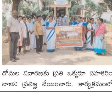
దోమల నివారణకు ప్రతి ఒక్కరూ సహకరించాలని ప్రతిజ్ఞ చేయించారు. కార్యక్రమంలో

ప్రజాభూమి ప్రతినిధి-ఆగిరిపల్లి ప్రపంచ డెంగ్యూ దినోత్సవం సందర్భంగా ఆగిరిపల్లి ఈడర్, సగ్గూరు ప్రాథమిక వైద్యశాల ఆధ్వర్యంలో శనివారం అవగాహన కార్యక్రమాలు నిర్వహించారు. ఈ సందర్భంగా ఆ గ్రామాల్లో రాబిలు, గ్రూప్ సమావేశాలు నిర్వహించి ప్రజలకు డెంగ్యూ వ్యాధి నివారణ చర్యలపై అవగాహన కల్పించారు. అలాగే పరిసరాలను పరిశుభ్రంగా ఉంచుతూ