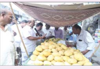
ప్రజా భూమి ప్రతినిధి వెంకటగిరి. ముఖ్యమంత్రి నారా చంద్రబాబు నాయుడు మరియు ఉప ముఖ్యమంత్రి పవన్ కళ్యాణ్ ల పిలుపు మేరకు "స్వచ్ఛ ఆంధ్ర - ప్లాస్టిక్ రహిత రాష్ట్రం" పథకంలో భాగంగా వెంకటగిరి పురపాలక సంఘం వదిలిపోయి తనివారం భారీ అవగాహన కార్యక్రమం జరిగింది.