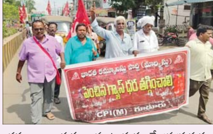
ప్రజా భూమి ప్రతినిధి, గూడూరు, కేంద్ర ప్రభుత్వం పెంచిన పెట్రోల్, డీజిల్, గ్యాస్, ధరలు తగ్గించాలని, జిల్లా కమిటీ ఇచ్చిన పిలుపు మేరకు శనివారం రోజు సి.పి.ఎం. సి.ఐ.టి.యూ ప్రజా సంఘాల నాయకులు, అధికారి, ఆధ్వర్యంలో గూడూరు పాత బస్టాండ్ వద్ద ఆటోలను మోకలతో లాగుతూ నిరసన ప్రదర్శన చేయడం జరిగింది.