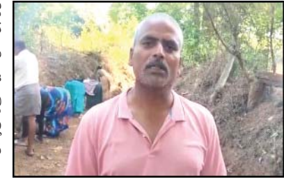
ప్రజాభూమి ప్రతినిధి పాకాల. ఆంధ్రప్రదేశ్ రాష్ట్ర ప్రభుత్వం గ్రామీణ అభివృద్ధి, సాగు నీటి సదుపాయాల పెంపు, రైతుల సంక్షేమం కోసం జలధార -- జలహారిత పథకంను విస్తృతంగా అమలు చేస్తోంది.