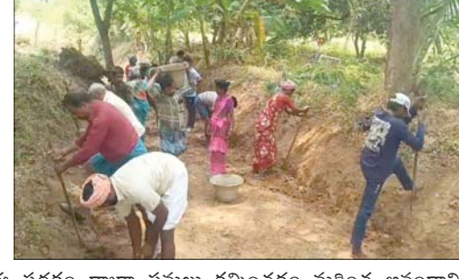
ప్రజాభూమి ప్రతినిధి పాకాల. ఆంధ్రప్రదేశ్ రాష్ట్ర ప్రభుత్వం గ్రామీణ అభివృద్ధి, సాగు నీటి సదుపాయాల పెంపు, రైతుల సంక్షేమం కోసం జలధార -- జలహారిత పథకంను విస్తృతంగా అమలు చేస్తోంది.