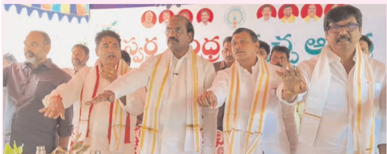
ప్రజా భూమి ప్రతినిధి-ఏలూరు

ప్రజలు సింగిల్ యూజ్ ప్లాస్టిక్ వినియోగాన్ని తగ్గించుకుని స్వచ్ఛమైన పరిసరాల కోసం సహకరించాలని జిల్లా తెలుగుదేశం పార్టీ అధ్యక్షులు, ఏలూరు ఎమ్మెల్యే బడేటి చంటి సూచించారు. కూటమి ప్రభుత్వం చేపట్టిన స్వచ్ఛాంధ్ర-స్వచ్ఛాంధ్ర కార్యక్రమంలో భాగంగా ఏలూరులోని బావిశెట్టివారి పేటలో నిర్వహించిన కార్యక్రమంలో ఆయన పాల్గొన్నారు. ఈ సందర్భంగా స్థానిక ప్రజలతో స్వచ్ఛతపై ప్రతిజ్ఞ చేయించి, మొక్కలు నాటారు. పారిశుధ్య నిర్వహణలో మెరుగైన పనితీరు కనబరిచిన కార్మికులను సన్మానించి బహుమతులు అందజేశారు. ప్లాస్టిక్ వల్ల పర్యావరణ కాలుష్యం పెరిగి ప్రజలకు అనేక రకాల వ్యాధులు వస్తున్నాయని ఎమ్మెల్యే చంటి పేర్కొన్నారు. భవిష్యత్తు తరాలకు ఆరోగ్యకరమైన వాతావరణం అందించాలంటే ప్లాస్టిక్ వినియోగంపై నియంత్రణ అవసరమన్నారు. కార్యక్రమంలో పలువురు ప్రజాప్రతినిధులు, అధికారులు, కూటమి నాయకులు పాల్గొన్నారు.