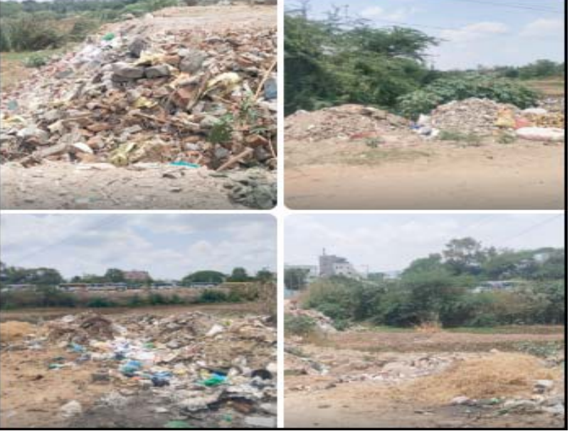
అధికారులు ఇప్పటికైనా స్పందించి రోడ్ల వకన్న శిథిలాలను వేరుకుండా కఠిన చర్యలు తీసుకోవాలని ప్రజలు డిమాండ్ చేస్తున్నారు. భవనాలను కూర్చితేయజమానులు తప్పనిసరిగా వ్యర్థాలను డంపింగ్ యార్డులకు తరలించేలా నిబంధనలు అమలు చేయాలని, ఉల్లంఘించిన వారిపై జరిమానాలు విధించాలని వాహనదారులు కోరుతున్నారు.

ప్రజా భూమి ప్రతినిధి తిరుపతి రూరల్ తిరుపతి పరిసర ప్రాంతాల్లో రహదారుల వెంట భవన శిథిలాల వ్యర్థాలు పేరుకుపోవడం తీవ్ర ఆందోళనకు గురిచేస్తోంది. పట్టణాలు, గ్రామాల్లో పాత గృహాలను జేసీబీలతో కూర్చితేసి, ఆ శిథిలాలను జాతీయ రహదారులు, ప్రధాన రహదారులు, గ్రామీణ రోడ్ల వకన్న నిర్లక్ష్యంగా పోషించడంతో వాహనదారులు తీవ్ర ఇబ్బందులు ఎదుర్కొంటున్నారు. ప్రస్తుతం ప్రజలు పాత ఇళ్ల స్థానంలో ఆధునిక నమూనాలతో కొత్త గృహాలను నిర్మించుకునేందుకు ఆసక్తి చూపుతున్నారు. ఈ క్రమంలో కూర్చితేసిన భవనాల నుంచి వచ్చిన ఇటుక ముక్కలు, సిమెంట్ గడ్డలు, ఇసుక రాళ్లు, స్టీల్ వ్యర్థాలను సరైన విధంగా తొలగించకుండా రోడ్ల వకన్నే పడేస్తున్నారు. ఫలితంగా రాత్రి వేళల్లో ఇవి వృష్టంగా కనిపించక ద్విచక్ర వాహనదారులు ప్రమాదాలకు గురవుతున్నారు. ముఖ్యంగా తనపల్లి, రహదారి పరిసర ప్రాంతాలు, గ్రామీణ ప్రధాన రోడ్ల వెంట పెద్ద ఎత్తున శిథిలాల కుప్పలు కనిపిస్తున్నాయి. రోడ్డు అంచులు ఆక్రమించడంతో వాహనాల రాకపోకలకు అంతరాయం ఏర్పడుతోంది. ప్రమాదవశాత్తు వాహనాలు ఈ వ్యర్థాలకు తగిలితే అందులో ఉన్న ఇసుక కమ్మలు, స్టీల్ రాడ్లు గాయాలకు కారణమవుతున్నాయి. ఇప్పటికీ పలువురు వాహనదారులు గాయపడిన ఫుటనలు చోటుచేసుకున్నాయని స్థానికులు ఆవేదన వ్యక్తం చేస్తున్నారు. అదేవిధంగా వర్షాకాలం నమీపిస్తున్న నేపథ్యంలో ఈ వ్యర్థాలు డ్రైనేజీలను మూసివేసి నీటి నిల్వలకు దారితీసే ప్రమాదం కూడా ఉందని ప్రజలు చెబుతున్నారు. రోడ్ల వకన్న పేరుకుపోయిన శిథిలాలు దుమ్ము, ధూళి పాస్త్రీకి కారణమై స్థానికులకు శ్వాసకోశ సమస్యలు తలెత్తే అవకాశం ఉందని వైద్య నిపుణులు హెచ్చరిస్తున్నారు. పంచాయతీ అధికారులు, భవన నిర్మాణ శాఖ, రహదారుల శాఖ