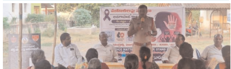
మహిళలు చట్టాలపై అవగాహన కలిగి ఉండాలి.