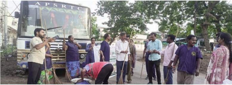
ప్రజాభూమి బ్యూరో కృష్ణాజిల్లా

45వ డివిజన్లో జోరూ ఆవరేషన్ క్లీన్ స్వీప్. మూడో రోజుకు చేరిన పాలిశుద్ధి యజ్ఞం