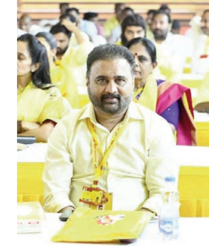
గందరగోళానికి నెట్టేస్తున్నారని అని ఎంపీ ఎడ్డెనా చేశారు.