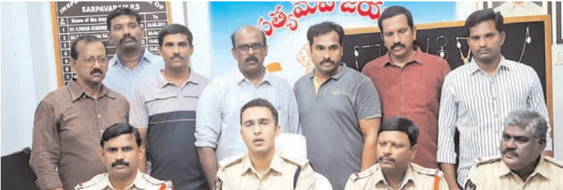
ప్రజాభూమి ప్రతినిధి - కాకినాడ రూరల్