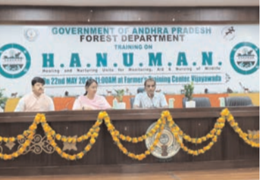
అటవీ అధికారులు, సిబ్బంది పాల్గొన్నారు.

యాప్ తో అనుసంధానించినట్లు చెప్పారు. పులులు, చిరుతల కటకటలను పర్యవేక్షించడం, కెమెరా ట్రాప్ డేటా సేకరణ ద్వారా మానవ-వన్యప్రాణి ఘర్షణలను తగ్గించవచ్చన్నారు. కార్యక్రమంలో ఏలూరు డివిజన్ కు చెందిన సుమారు 32 మంది