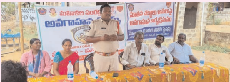
ప్రజా భూమి ప్రతినిధి-నూజివీడు

పోలీస్ ఉన్నతాధికారుల ఆదేశాలతో నూజివీడు రూరల్ ఎన్ఐ జ్యోతిబను తూర్పు దిగవల్లి గ్రామంలో పోలీసు సిబ్బందితో కలిసి సామాజిక అవగాహన సదస్సు నిర్వహించారు. ఈ సందర్భంగా మహిళల భద్రత, ఈజీ టీజింగ్ నివారణ, సైబర్ మోసాలు, దొంగతనాల నివారణ, అత్యవసర సేవ వినియోగంపై గ్రామస్థులకు అవగాహన కల్పించారు. బ్యాంకు ఓటీపీలు, పిన్ సంబంధ వ్యవహారాలపై అనుభూతికర లింకులను క్లిక్ చేయవద్దని సూచించారు. అత్యవసర పరిస్థితుల్లో వెంటనే 112, సైబర్ మోసాలపై 1930 నంబర్లకు ఫిర్యాదు చేయాలని తెలిపారు. గ్రామాల్లో అపంచితలు కడలికలపై అప్రమత్తంగా ఉండి, సీసీ తెలంగాలు ఉపాధి చేసుకోవాలని సూచించారు. కార్యక్రమంలో గ్రామ పెద్దలు, మహిళలు, యువత మరియు పోలీసు సిబ్బంది పాల్గొన్నారు.