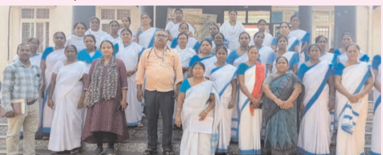
ప్రజా భూమి ప్రతినిధి-ఆగిరిపల్లి

ఆగిరిపల్లి ప్రాథమిక ఆరోగ్య కేంద్రంలో మంగళవారం కిల్లారి కాలి సేవలపై ఆకా కార్యకర్తలు, ఏఎన్ఎంలకు ప్రత్యేక అవగాహన కార్యక్రమం నిర్వహించారు. కిల్లారి రీజిస్ట్రార్ ప్రోగ్రామ్ ఆఫీసర్ రాజు మాట్లాడుతూ, కేంద్ర ప్రభుత్వం గర్బులు మరియు బాలింతలకు తల్లి--శిశు ఆరోగ్య సమాచారాన్ని వాయిస్ కాల్స్ ద్వారా అందించేందుకు ఈ సేవలను అమలు చేస్తున్నట్లు తెలిపారు. గర్భధారణ నాలుగో నెల నుంచి శిశువు ఏనాడీ చచ్చువచ్చు వచ్చే వరకు ఆరోగ్య సూచనలు మొత్తంలో చేరుతాయని చెప్పారు. కిల్లారి కాలి నంబర్ 911600403660 ను మొబైల్లో సేవ చేసేవారు కాల్స్ వివరాలు సూచించారు. అవసరమైతే 14423 లోల్ ఫ్రీ నంబర్ కాలి చేసి సమాచారాన్ని తిరిగి వినవచ్చున్నారు. కార్యక్రమంలో వైద్యులు, సీఎస్ఎఫ్, ఆరోగ్య సిబ్బంది పాల్గొన్నారు.