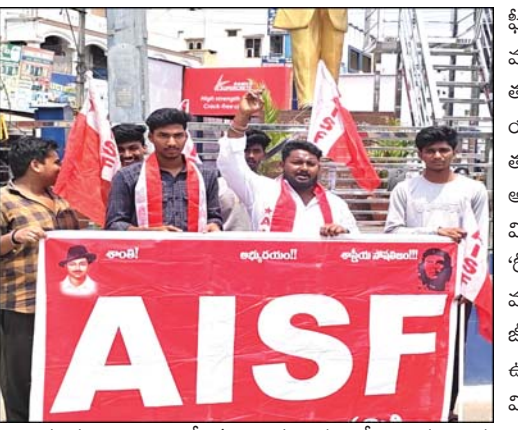
విద్యాసంస్థల అకౌంట్లలో కూడా ముందుగానే కొంత మొత్తం తప్పనిసరిగా జమ చేయాలని ఒత్తిడి చేస్తున్నారు. అంటే చదువు ప్రారంభం కాకముందే డబ్బులు దిపాజిట్ చేయించుకొని, విద్యను ఒక రీఛార్జ్ వ్యవస్థలా మార్చేస్తున్నారు. ఇది పూర్తిగా మోసపూరిత విధానం. విద్యను సాధారణ ప్రజలకు