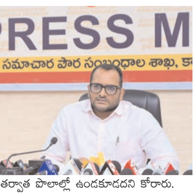
PRESS M సమాచార పార సంబంధాల శాఖ, కా