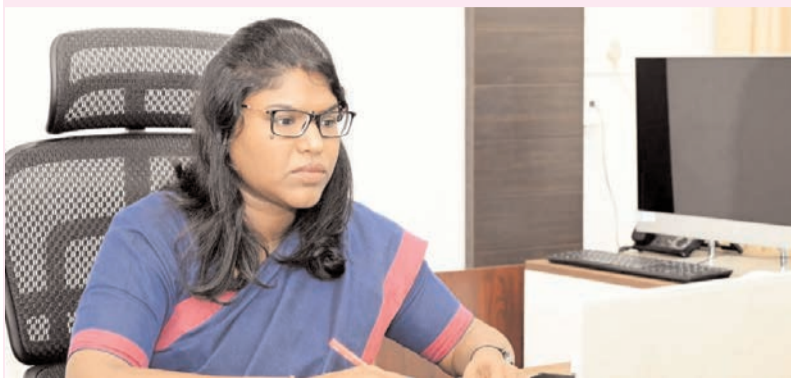
ప్రజా భూమి ప్రతినిధి-ఎలూరు జిల్లా.