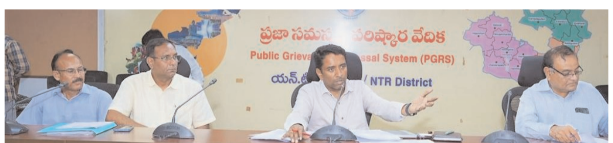
Public Grievance Redressal System (PGRS)