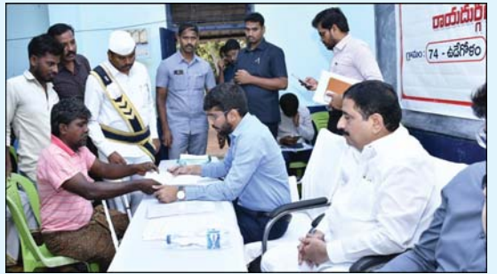
జిల్లాగా తీర్చిదిద్దడమే లక్ష్యం మన్నారు. గౌరవ ముఖ్యమంత్రి గారి ఆదేశాల మేరకు జిల్లా వ్యాప్తంగా రెవెన్యూ సమస్యల శాశ్వత పరిష్కారమే లక్ష్యంగా ప్రతిష్టాత్మకంగా చేపట్టిన ఒక గ్రామం - నాలుగు సందర్శనలు కార్యక్రమం శరవేగంగా సాగుతోందన్నారు. గతంలో నిర్వహించిన రెవెన్యూ సదస్సులకు, ఈ కార్యక్రమానికి చాలా వ్యత్యాసం ఉందని, గతంలో గ్రామాల సువి అధ్యయనం తీసుకుని తహసీల్దార్ లేదా అధ్యయన ఆఫీసర్లతో పరిష్కరించేవారని, కానీ ఇప్పుడు, సమస్యల పూర్తి నివారణ కోసం ప్రతివారం ఒక తహసీల్దార్ ఒక గ్రామాన్ని వరుసగా నాలుగు వారాల పాటు సందర్శిస్తారన్నారు. మొదటి వారం గ్రామంలో ముందస్తుగా దండోరా వేయించి ప్రచారం కల్పిస్తారని, ప్రజల సువి రెవెన్యూ సమస్యలపై అధ్యయనం చేసి, వారికి రీడీలు అందజేస్తారన్నారు. రెండో, మూడో వారంలో స్వీకరించిన అధ్యయనం ఒక వారం వ్యవధిలో పేర్కొనడం వరకు పరిష్కరించి, తదుపరి వారాల్లో మళ్లీ అదే గ్రామానికి వెళ్లి పురోగతిని సమీక్షిస్తారన్నారు. నాలుగవ వారం తహసీల్దార్ తన టీతో (విలేజ్ సర్వేయర్, విలేజ్ రెవెన్యూ ఆఫీసర్, రెవెన్యూ సిబ్బంది) కలిసి గ్రామంలోనే ఉండి, సాధ్యమైన అన్ని సమస్యలను పూర్తిగా పరిష్కరిస్తారని, ఒకవేళ సాంకేతిక లేదా చట్టపరమైన కారణాల వల్ల ఏదైనా సమస్య పరిష్కారం కాకపోతే, ఆ విషయాన్ని నేరుగా గ్రామస్తుల సమక్షంలోనే దరఖాస్తుదారునికి స్పష్టంగా వివరిస్తారన్నారు. ప్రస్తుతం రాబోయే సంవత్సరం 50 శాతం పైగా రీ-సర్వే పనులు పూర్తయ్యాయని, మిగిలిన గ్రామాల్లో రాబోయే సంవత్సరంలోగా రీ-సర్వే పూర్తి చేస్తామని తెలిపారు. జిల్లా వ్యాప్తంగా గత రెండు వారాలుగా ఈ కార్యక్రమం ముమ్మరంగా సాగుతోందని, ఇప్పటికే 32 గ్రామాల్లో తహసీల్దార్లు రెండు విడతల సందర్శనలను పూర్తి చేశారని పేర్కొన్నారు. జిల్లా కలెక్టర్, జాయింట్ కలెక్టర్, అధ్యయన అధికారులు కూడా ప్రతి నియోజకవర్గంలో నెలకు కనీసం ఒక గ్రామాన్ని సందర్శించి పర్యవేక్షిస్తున్నారున్నారు. ఒక్కొక్క తహసీల్దార్ పరిధిలో 15 నుండి 20 రెవెన్యూ గ్రామాల ఉంటాయని, రాబోయే 15 నుండి 20 నెలల కాలంలో ప్రతి గ్రామాన్ని ఈ కార్యక్రమం కింద కవర్ చేస్తామని చెప్పారు. మొదటి విడతగా జిల్లాలోనే అత్యధికంగా రెవెన్యూ సమస్యలు ఉన్న గ్రామాలను ప్రాధాన్యత క్రమంలో ఎంపిక చేసినట్లు పేర్కొన్నారు. ప్రతి గ్రామాన్ని "రెవెన్యూ గ్రీవెస్" లేని గ్రామం"గా తీర్చిదిద్దడామన్నారు. ఈ కార్యక్రమంలో తహసీల్దార్ హుకుమార్, ఆయా శాఖల అధికారులు, స్థానిక నాయకులు, ప్రజలు పాల్గొన్నారు.