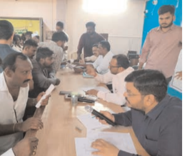
ఒక గ్రామం - నాలుగు సందర్శనలు