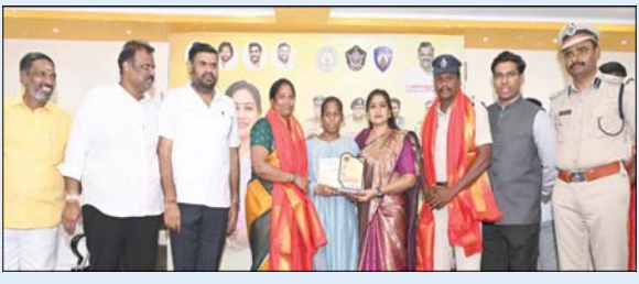
ప్రజాభూమి ప్రతినిధి: శ్రీకాళహస్తి టౌన్