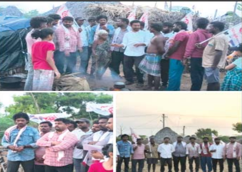
ప్రజా భూమి ప్రతినిధి - తొట్టంబేడు మండలం.