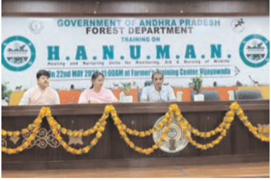
అటవీ అధికారులు, సిబ్బంది పాల్గొన్నారు.

యాప్ తో అనుసంధానించినట్లు చెప్పారు. పులులు, చిరుతల కంటికిలను పర్యవేక్షించడం, కెమెరా ట్రాప్ డేటా సేకరణ ద్వారా మానవ-వన్యప్రాణి ఘర్షణలను తగ్గించవచ్చన్నారు. కార్యక్రమంలో ఏలూరు డివిజన్ కు చెందిన సుమారు 32 మంది