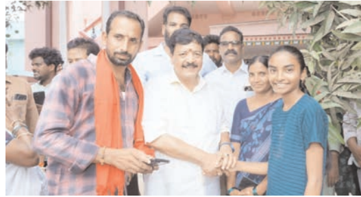
ప్రజాభూమి ప్రతినిధి - నిడదవోలు

నిడదవోలు పట్టణంలో ఆరోగ్య శివారు వేగవంతం చేస్తున్నందుకు పలువురు స్థానికులు మంత్రి దుర్గేష్ కి కృతజ్ఞతలు తెలిపారు. వందల పూర్వాయితే దశాబ్దాల కాలంగా ఉన్న ట్రాఫిక్ జంక్షన్లు తొలగిపోతాయని హర్షం వ్యక్తం చేశారు. అనంతరం జెడ్పీ హెచ్ఎస్ శెట్టిపేటలో చదువుతున్న తాళ్ళపాలెంకు చెందిన భవన యమున అనే విద్యార్థిని ప్రభుత్వ పాఠశాలలో చదివి పదో తరగతిలో 547 మార్కులు సాధించిన సందర్భంగా మంత్రి దుర్గేష్ ప్రత్యేకంగా అభినందించారు. భవిష్యత్తులో ఐఐఐటీ చదువుకొనని కోరిన ఆ బాలికకు ఉన్నతాధికారులతో మాట్లాడి అవసరమైన పూర్తి సహకారం అందిస్తామని భరోసా ఇచ్చారు. అదే విధంగా కిడ్నీ వ్యాధితో బాధపడుతున్న ఒక మహిళ తన సమస్యను వివరించగా మెరుగైన వైద్యం అందేలా చర్యలు తీసుకుంటానని మంత్రి దుర్గేష్ హామీ ఇచ్చారు.