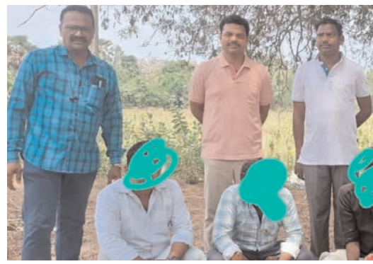
ప్రజాభూమి ప్రతినిధి - అమలాపురం