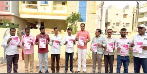
ప్రజా భూమి ప్రతినిధి రైల్వేకోడూరు

తిరుపతి జిల్లా రైల్వే కోడూరులో గురువారం, ఏపీఎండిసి పరిరక్షణ కమిటీ ఆధ్వర్యంలో, చలో ఏపీ ఎమ్ డి సి కరపత్రాలు విడుదల చేసిన సందర్భంగా, కస్టోడీయన్, కుండలపల్లి మహాలక్ష్మి, మంగంపేట బైరేటిన్ కు కోడూరు నియోజకవర్గ ప్రజలకు అవినాభావ సంబంధం ఉంది. ఇది భావోద్వేగంతో కూడింది. ఇక్కడి రామ, రఘు...చెట్ల, చేమతో విదదీయరాని బంధం ఇక్కడ జీవించిన వారిది. వేలాదిమంది ప్రజలకు తామున్న చోటే తెల్ల బంగారు నిల్వలు ఉన్నాయని తెలియదు. భవిష్యత్తులో ఈ రామ రాష్ట్ర రాజకీయాలను, రాయలసీమను శాసించగలిగి ఊహించలేదు. తమ ఊరి ఆభివృద్ధికై. ఈ మట్టితో తమకున్న బంధాన్ని వదిలి... పరిశ్రమ ఆభివృద్ధికి ప్రజలు 'నేలను' ఇచ్చారు. నాటి ఆ త్యాగం వూరా అవుతుంటే చూస్తూ ఉండకపోతే? ఏడాదికి 1000 కోట్లకు పైగా టర్నివర్, వేలాది కుటుంబాలు పరిశ్రమను ఆధారం చేసుకుని సాగిస్తున్న జీవనం బుగ్గి పాలు అయిపోతే మోసం వహించాలా మన కళ్ళెదురుగా కనిపిస్తున్న 60 లక్షల ఉద్యోగుల నిల్వలను ప్రభుత్వ నియమ నిబంధనలకు విరుద్ధంగా పౌడర్ బదులు రాయల్ విదేశాలకు ఎగుమతి చేస్తుంటే నిమ్మక సీరీస్లన్నట్లు సమాజం ఊరుకోవాలా? మరో 20 ఏళ్ల పాటు నడచాల్సిన పరిశ్రమ రానున్న రెండేళ్లకే ఖాళీ అయిపోతే ఉసురుమంటూ.. బతికితరుకు ఇక్కడ ప్రజలు వలసలు పోవాలా? ఈ తప్పుడు విధానాన్ని ఆపండి! ప్రజల జీవితాలతో, ఉద్యోగుల ఉపాధితో, నిర్దోషుల ఆశలతో, విద్యార్థుల భవిష్యత్తుతో చెలాటమాడవద్దు. అక్రమ ఎగుమతులు ఆపండి! అన్న నేరానికి ఇక్కడి కార్మిక నాయకులు పోలీస్ స్టేషన్ చుట్టూ తిరుగుతూ.. పోలీసు వేధింపులకు గురి కావాలా? ఇది ఏ ఒక్కటి వ్యక్తిగత సమస్యా కాదు! ఓ కుటుంబానికి సంబంధించింది అంతకన్నా పెద్దది! రైల్వే కోడూరు నియోజకవర్గానికి, ఇక్కడి ప్రజానికానికి అన్నం పెట్టి అన్నపూర్ణ మన హామీగా పై జరుగుతున్న దాడిని ఎదుర్కోవటం. ఈ పని చేయకపోతే