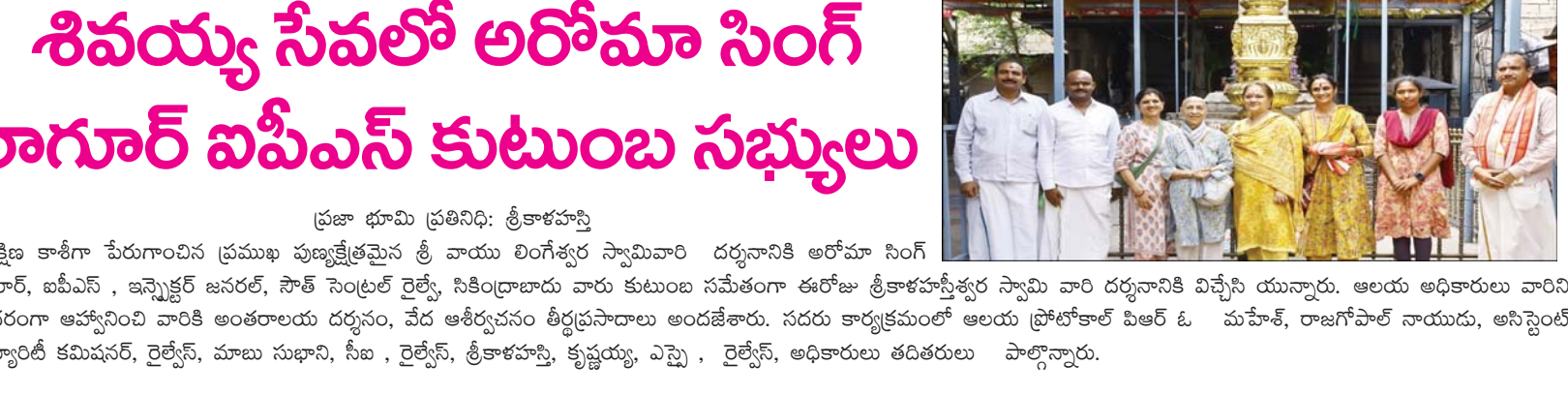
ప్రజా భూమి ప్రతినిధి, శ్రీకాళహస్తి