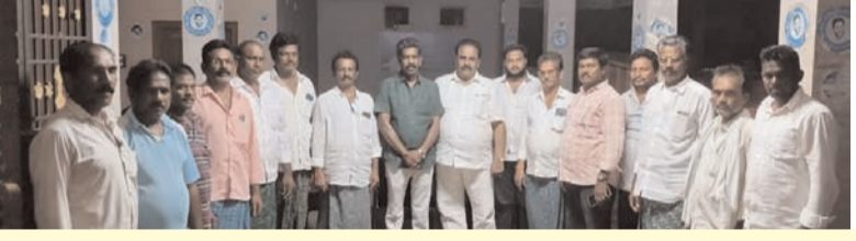
ప్రజా భూమి ప్రతినిధి-కామవరపుకోట