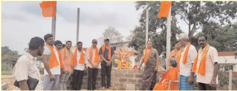
ప్రజా భూమి ప్రతినిధి-జీలుగుమిల్లి

జీలుగుమిల్లి ప్రధాన కూడలిలో వెలసిన శ్రీశ్రీ బాల జగదాంబ అమ్మవారికి శనివారం భక్తులు ఘనంగా పూజలు నిర్వహించారు. గ్రామదేవత శ్రీ జగదాంబ అమ్మవారి ఆలయం ఎదురుగా నాలుగు రోడ్ల కూడలిలో అమ్మవారి వెలయడం గ్రామానికి శుభపరిణామమని గ్రామస్థులు హర్షం వ్యక్తం చేశారు. ఉదయం నుంచే మహిళలు, భక్తులు పెద్ద సంఖ్యలో అమ్మవారి దర్శించుకుని ప్రత్యేక పూజలు చేశారు. గ్రామం సుభిక్షంగా ఉండాలని, పాడివంటలు సమృద్ధిగా పండాలని, ప్రజలు సుఖాంతలతో జీవించాలని అమ్మవారిని ప్రార్థించారు. భక్తిశ్రద్ధలతో నిర్వహించిన ఈ కార్యక్రమంలో హిందూ సంఘాల ప్రతినిధులు, గ్రామ పెద్దలు, మహిళలు పాల్గొన్నారు. ఆలయ నిర్వాహానికి ప్రతి ఒక్కరూ సహకరించాలని భక్తులు కోరారు.