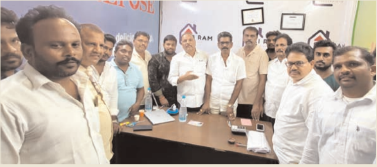
ప్రజా భూమి ప్రతినిధి, కామవరపుకోట