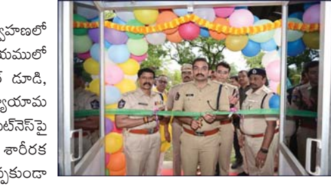
ప్రజా భూమి ప్రతినిధి: చిత్తూరు